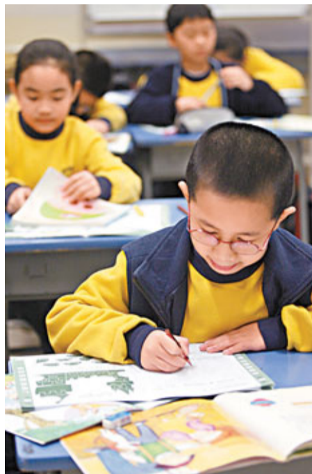
▲2011年全港性系統評估報告昨公布，小三生中英文科達標率進步最明顯。不過，有不少同學犯明顯錯誤，如於信封地址欄寫上網址，及將時間寫成「5時99分」、「下午三十時」等。