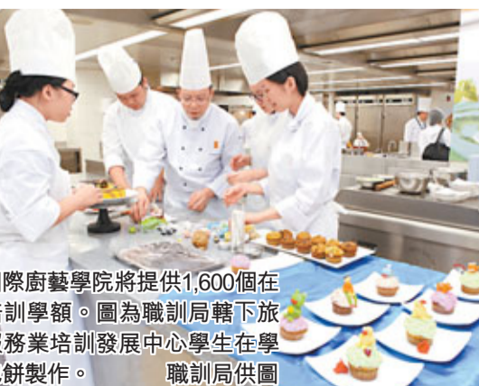
國際廚藝學院將提供1,600個在職培訓學額。圖為職訓局轄下旅遊服務業培訓發展中心學生在學習包餅製作。

職訓局現正物色合適地興建新學院，並希望新學院能與位處薄扶林中華廚藝學院及旅遊服務業培訓發展中心鄰近，讓資源能共用，發揮協同效應。孫明揚表示，學院校舍約需建築面積