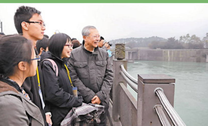
教育局局長孫明揚率領的800多名中學師生，在四川進行「四川體驗學習暨關懷之旅」。昨日代表團有機會參觀成都大熊貓繁育研究基地，孫明揚把握機會，親近國寶熊貓，與實地大熊貓合照(右圖)。另外，一行人到訪映秀鎮，了解當地震後重建工作，並參觀都江堰水利工程(上圖)。 ■香港文匯報記者 劉思諾