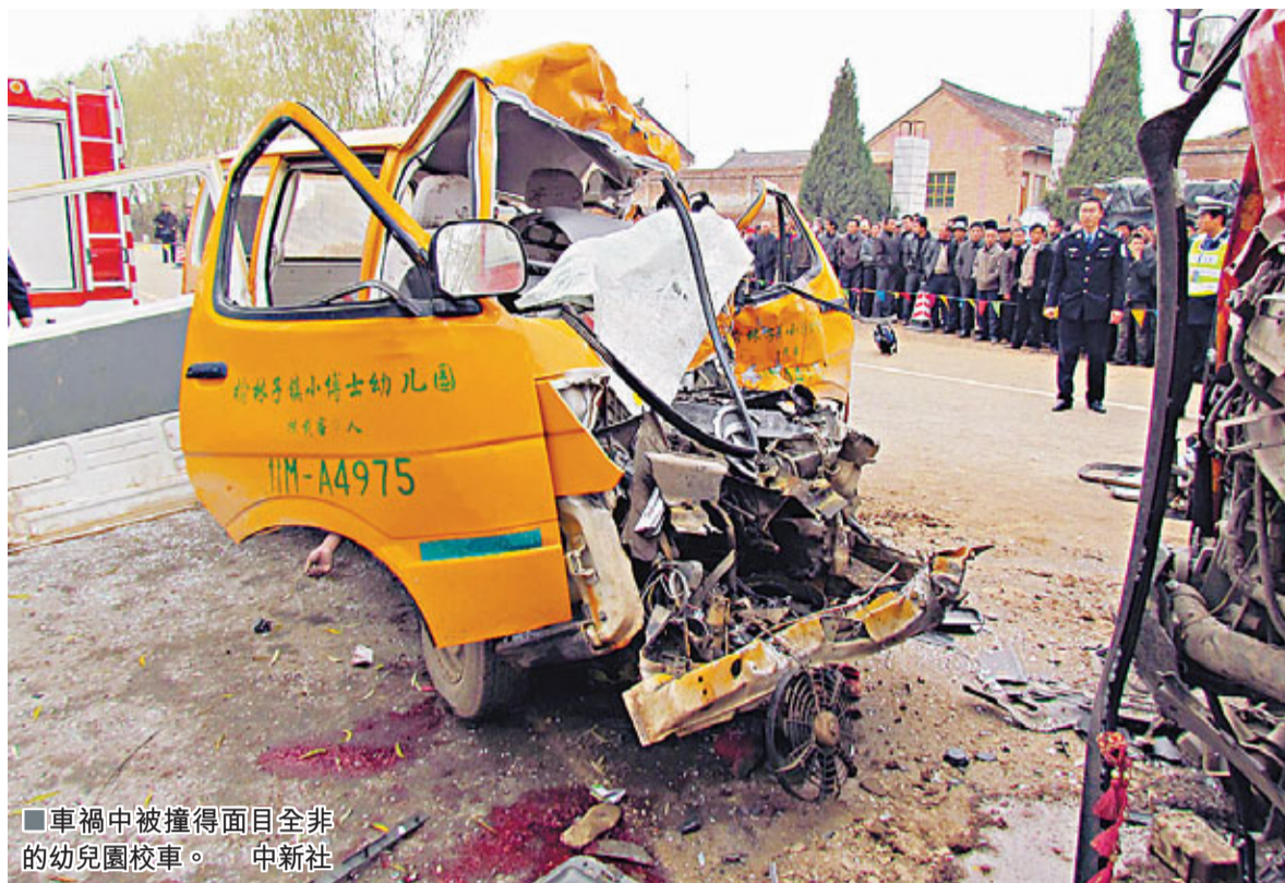
車禍中被撞得面目全非的幼兒園校車。