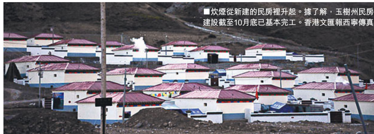
炊煙從新建的民房裡升起。據了解,玉樹州民房建設截至10月底已基本完工。

此外,玉樹州擁有豐富的自然旅遊資源與文化旅遊資源,可考慮以金融撬動玉樹旅遊業發展。在完成玉樹災後重建工作後,銀行等各金融機構將目光移向玉樹的旅遊業,以金融促進旅遊業的發展。