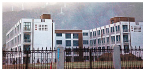
一座嶄新的校舍在玉樹州結古鎮拔地而起。

玉樹州金融辦還施行放貸銀行責任制,由八家銀行劃分區域,包區包乾,負責相關地區的貸款及金融服務。州政府從財政資金中拿出500萬資金出政策,責任明確,責任到行。7月21日,項目及銀行支持簽約儀式,拉出項目單,具體到項目和住戶,形成貸款無縫隙全覆蓋的效果。保障措一環套一環,環環相扣。其中,青海銀行、玉樹聯社、國開行負責玉樹縣;建設銀行和工商銀行負責稱多縣;國開行和中國銀行負責雜多縣;建設銀行和農業銀行負責治多縣;農商銀行和農發行負責囊謙縣;郵政儲蓄銀行和農業銀行負責曲麻萊縣。在此