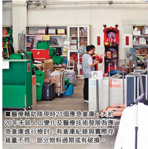
■醫療輔助隊現時21個應急倉庫,大約20年未就人口變化及醫療技術發展為應急倉庫進行檢討,有倉庫紀錄與實際存貨量不符,部分物料過期或有破損。