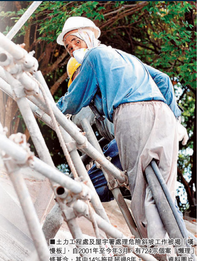
■土力工程處及屋宇署處理危險斜坡工作被揭「嘆慢板」,自2001年至今年3月,有724宗個案「懶理」修葺令,其中14%拖延超過8年。

為鼓勵業主盡快修葺危險斜坡,土力工程處設有諮詢服務協助業主,屋宇署更推行貸款計劃。但審計處發現,公眾對該兩項服務反應都冷淡。業主向諮詢服務組求助個案,由2001年59宗,減至去年的4宗;過去10年,屋宇署的申請貸款只有11宗,2宗撤回,其餘9宗獲批,涉及貸款總額為41萬元。審計處建議兩個部門檢討,制定及推行改善措施,並考慮加強宣傳。