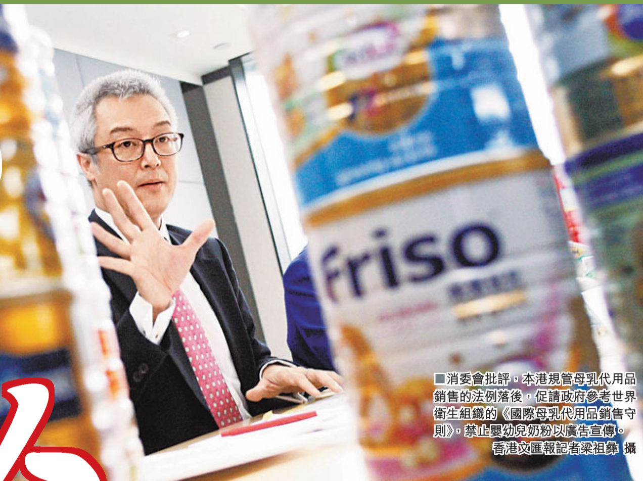
消委會批評，本港規管母乳代用品銷售的法例落後，促請政府參考世界衛生組織的《國際母乳代用品銷售守則》，禁止嬰幼兒奶粉以廣告宣傳。

香港文匯報訊（記者 嚴敏慧、林裕華）嬰幼兒奶粉廣告鋪天蓋地，不少更標榜含有益生菌、DHA、AA、可溶性膳食纖維等成分，聲稱能為寶寶補充營養，增強免疫力，甚至幫助智力發展。不過，消委會「踢爆」，有關添加並非嬰幼兒奶粉「必需成分」，廣告中聲稱的功效，更涉及誇大誤導，根本沒有足夠科學證據支持。消委會批評，本港規管母乳代用品銷售法例落後，促請政府參考世界衛生組織《國際母乳代用品銷售守則》，禁止嬰幼兒奶粉以廣告宣傳。此外，消委會呼籲家長為子女選擇配方奶粉時，不要受廣告的誇大聲稱影響。