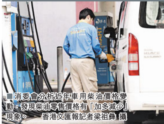
消委會分析近年車用柴油價格變動，發現柴油零售價格有「加多減少」現象。香港文匯報記者 梁祖彝 攝

香港文匯報訊（記者 嚴敏慧、林裕華）消委會分析近年車用柴油價格變動，發現柴油零售價格有「加多減少」現象。即使政府兩次減稅，柴油零售價與國際油價間的差距卻越來越大。2008年7月以前，每公升柴油價格差距約港幣3元，其後一度跳升至約6元。至2009年中至今，每公升柴油價格則在4元至5元徘徊。消委會推算，油公司5年前淨利潤每公升只有0.03元，現時已升至每公升0.83元，但油公司未有提供影響零售價詳細資料，未能全面評估油公司是否牟取暴利。消委會期望油公司公布更多定價資料。此外，消委會希望公平競爭法加快立法，以監察油公司有否聯手定價。