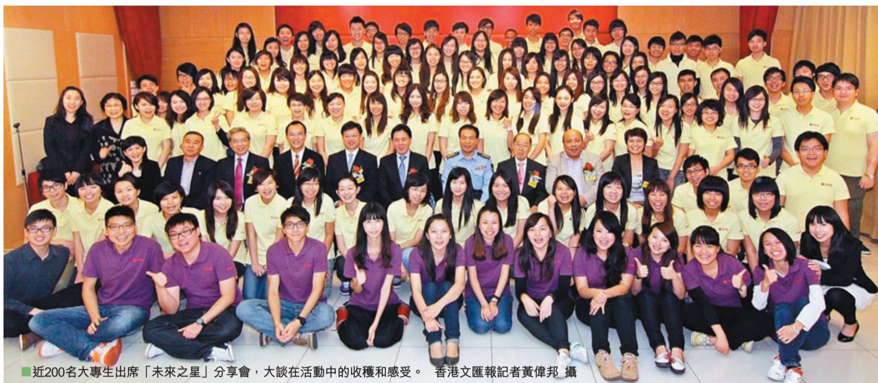
近200名大專生出席「未來之星」分享會，大談活動中的收穫和感受。

香港文匯報訊(記者 歐陽文情)香港與內地交流頻繁，為加強大專生對國情的認識，在國家教育部、中聯辦及香港特區政府的支持下，香港文匯報及未來之星同學會在暑假合辦了3項交流活動，讓約240位來自本地11所大專院校的學生有機會到內地親身體會國家發展。大會日前特別舉行分享會，讓各國友聚首一堂，匯報活動中的感受及得着。不少學生表示在行程中收穫良多，除了對國情了解更加深刻，也換來了真摯友誼，令人難以忘懷。