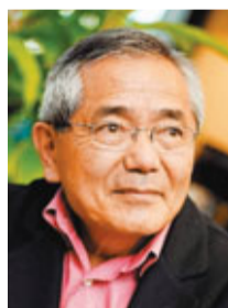
根岸英一將分享其科研經驗。

香港文匯報訊(記者 高鈺)「新鴻基地產諾貝爾獎得獎人傑出講座系列」最近邀請了2010年諾貝爾化學獎得主根岸英一作主講嘉賓，題目為「追尋夢想半世紀」。他將回顧多年來在科研路上的經歷，如何面對一場又一場的挑戰，達致獲頒諾貝爾化學獎的殊榮。