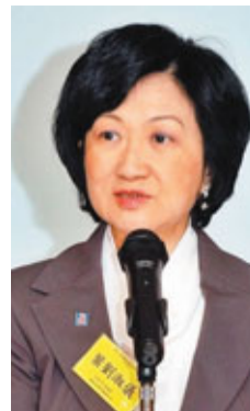
葉劉淑儀大讚未來之星是一個很好的平台。