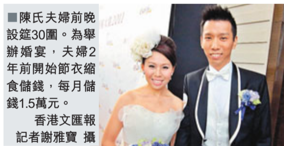
陳氏夫婦前晚設筵30圍。為舉辦婚宴,夫婦2年前開始節衣縮食儲錢,每月儲錢1.5萬元。

香港文匯報訊(記者 謝雅賢) 結婚屬人生大事,不少準新人都願意花錢籌備婚禮,創造了龐大的結婚消費市場。有調查發現,本港每對新人平均花費267,256元籌辦婚禮,按年上升9.5%,推算本港整體結婚消費總額高達140.6億元,創有調查以來的新高。負責調查的機構表示,婚宴酒席佔整個婚禮開支逾50%,是最高消費項目,因通脹加劇,導致食材價格上漲及人工成本上升,令酒席的平均消費額按年急升6.7%。