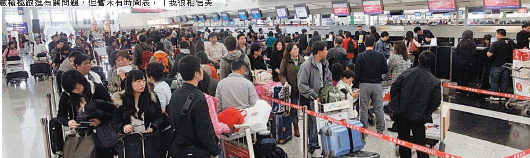
旅行社業界估計,倘特區免簽證待遇,每年到美國旅遊人數將增加10%。資料圖片