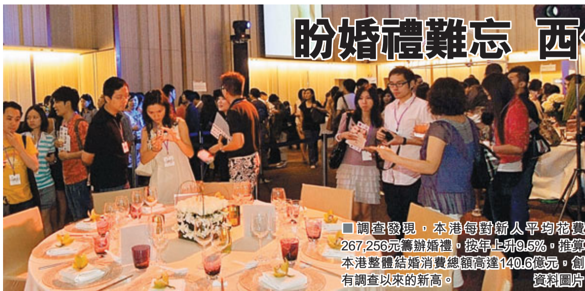
調查發現,本港每對新人平均花費267,256元籌辦婚禮,按年上升9.5%,推算本港整體結婚消費總額高達140.6億元,創有調查以來的新高。資料圖片

香港文匯報訊(記者 林裕華) 生活易的調查發現有59%受訪新人結婚開支最終較預算超出30%,有婚禮策劃人相信與年輕一輩在結婚大事上講究高檔和獨特有關,不少「80後」已西化,且夢想擁有1個獨一無二的婚禮,故在挑選婚紗、酒席菜式流程、拍攝婚紗照等都不惜工本,例如菜式上,以魚子醬和鵝肝代替炸蟹鉗,又在酒席場地增設舞池等,超支在所不計。