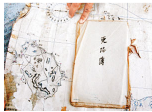
■一本抄於民國時期的《更路簿》。

義主要有以下兩方面：《更路簿》中記載的地名是由海南漁民命名並沿用至今，具有濃厚的海南方言特徵，例如以「峙」代替島嶼，以「沙」或「線」指暗礁等，充分證明海南居民開發建設西沙、南沙的悠久歷史，是證明南沙自古就是中國領土的有力證據；《更路簿》中所記載的航行範圍不同於一般的航海針經書，側重在西沙和南沙海域，有關國外更路的記載不是很多，書中所記載的航線、島礁地貌和風況以及海浪、潮汐、風向、風暴等水文和氣象信息，對研究中國航海史、南海開發史都具有珍貴的史料價值。