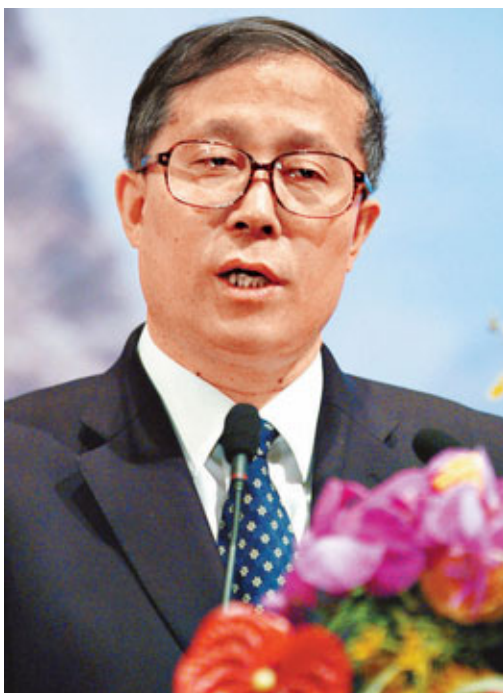
■湖北省委書記李鴻忠。

面對「十二五」，湖北繼續依靠以建設中部地區支點的戰略思想為指導，為實現跨越式發展，又提出了新的目標和理念。李鴻忠提出：「湖北當前發展面臨著加速度效應、爆發效應和機遇效應，在經濟總量上，『十二五』需實現從15,000億元向25,000億元的跨越，但更重要的跨越轉變需體現在『質』上。湖北的經濟發展處於工業化中級階段，但是發展標準必須按照科