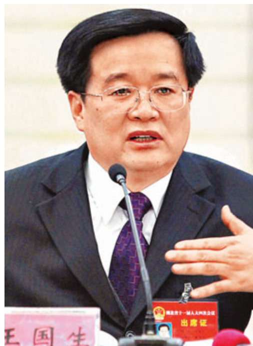
■湖北省人民政府省長王國生。