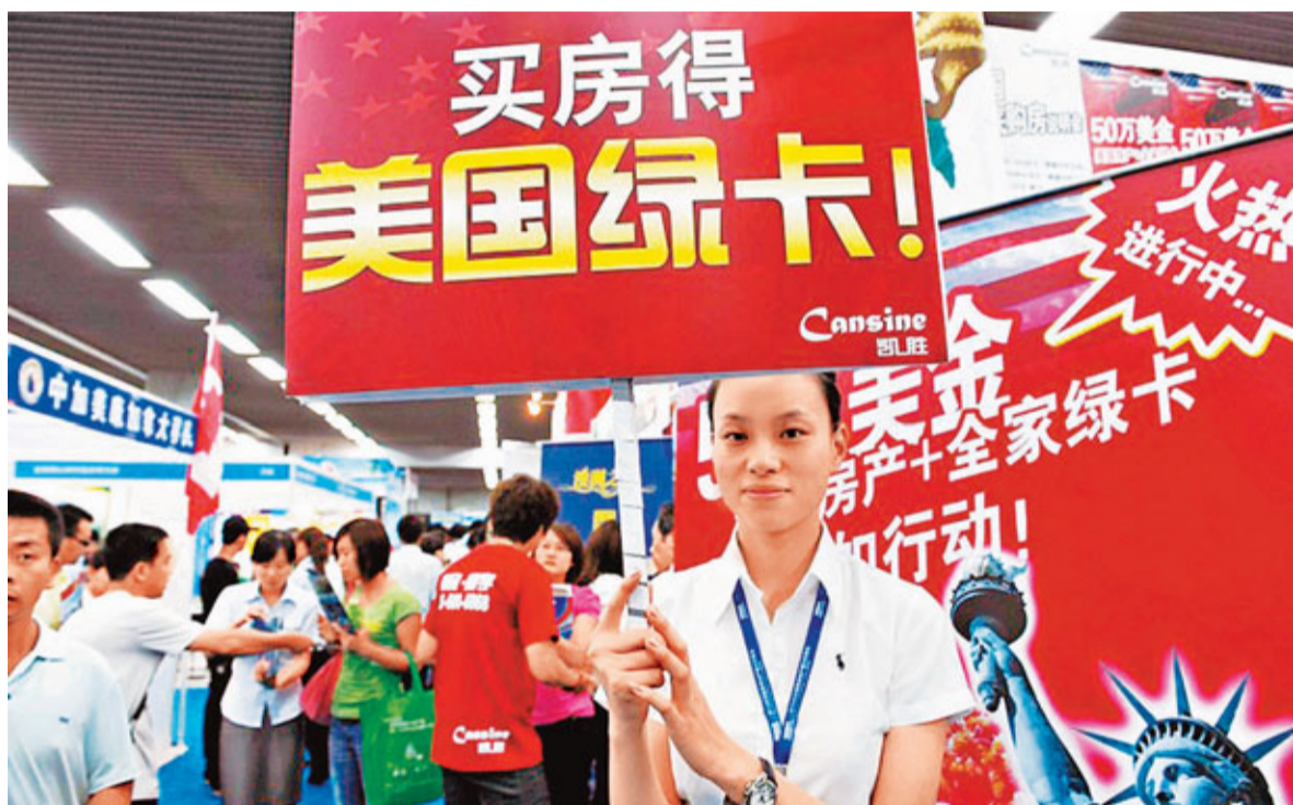
■近期，由於經濟復甦乏力，有美國參議員提交在美國購買50萬美元房產可獲得綠卡的議案，主要針對的就是中國人。資料圖片

中國招商銀行和貝恩資訊公司聯合進行的一份調查稱，中國約60%的「高淨值人士」——即那些擁有1,000