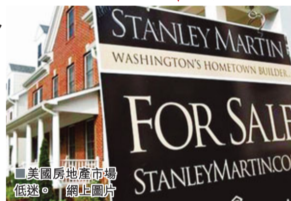
■美國房地產市場低迷。

近期，由於經濟復甦乏力，美國的政客們開始動起國際購房者的主意。美國議員提出議案稱，投資50萬美元在美國購買房產就可以得到每3年更新一次的居留簽證綠卡。這一議案主要針對的就是中國人。消息一出，立即引發美中兩國熱議。專家認為這項議案預示了美國或許在未來會進一步鼓勵投資移民，刺激疲軟的美國經濟。