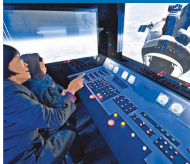
■13日，北京眾多市民來到中國國際展覽中心，參觀「第六屆中國北京國際文化創意產業博覽會」第八展廳的航天展台，進入「天宮一號」太空模擬倉，模擬駕駛「天宮一號」與「神舟八號」的太空對接。

香港文匯報訊(記者 江鑫嫻 北京報導)據中國載人航天工程新聞發言人透露，中國首個空間實驗室天宮一號預計將於14日晚間與神舟八號飛船進行第二次交會對接。專家表示，第二次交會對接將面臨強光干擾等更多考驗。 據《新民晚報》報導，交會對接大型地面試驗系統原負責人、上海宇航系統工程研究所技術顧問、研究員陶建中表示，要按計劃完成第二次「太空擁吻」，神舟八號與天宮一號的組合體將先經歷「小別」。按計劃，14日晚，重達16噸多的組合體將先分離，退到相距140米的停泊點上稍作停留後再度交會對接。據陶建中介紹，兩個飛行器分離最短約需3分鐘。