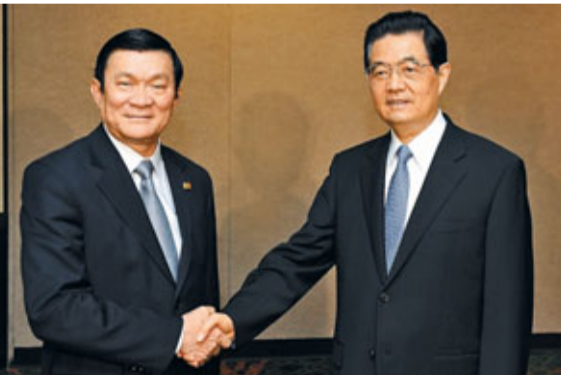
胡錦濤12日在美國夏威夷會見越南國家主席張晉創。

哈珀完全贊同胡錦濤關於發展兩國關係的意見，表示加方高度重視發展中加戰略夥伴關係。加方願同中方一道，在更廣泛領域開展合作，應對共同面臨的挑戰。雙方要深化戰略和經濟合作夥伴關係，加速加中經濟互補性聯合研究。盡早達成加中投資保護協定。拓展能源領域合作。促進教育等人文領域交流。加強在多邊領域磋商和協調，共同反對保護主義。