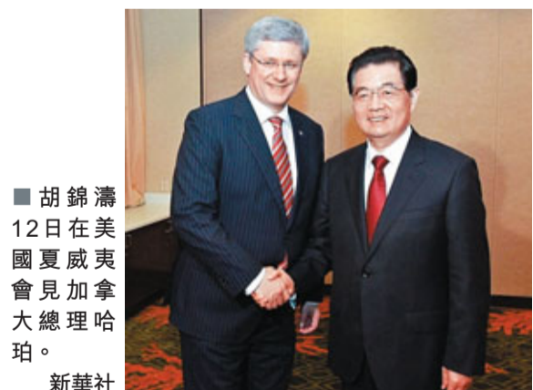
胡錦濤12日在美國夏威夷會見加拿大總理哈珀。

胡錦濤表示，近年來，中加關係呈現良好發展勢頭。兩國高層和各級別交往密切。去年6月，他對加拿大進行了成功的國事訪問，雙方重申致力於發展中加戰略夥伴關係，兩國關係進入新的發展階段。兩國經貿合作成效顯著，在能源資源、科技、環保、旅遊、教育、執法等方面的交流合作取得積極進展，在國際和地區事務中的溝通和協調不斷加強。