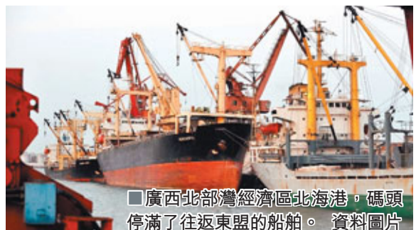
廣西北部灣經濟區北海港碼頭停滿了往返東盟的船舶。資料圖片

在會見吉滴叻時，陳德銘說，中國—東盟自貿區是目前世界上最大的自貿區，應推進各成員之間的務實合作，在公路、鐵路、港口、通信、電力等方面加強互聯互通建設，讓中國和東盟國家的企業和百姓盡早受益。中國鼓勵企業到東盟國家投資，可與泰國及東