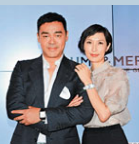
■On劉青雲，特製自動機芯，配以精鋼錶殼、藍寶石水晶玻璃錶面，凸顯男士魅力。

名錶的價值很多時與錶身上的鑽石多少掛鉤。鑽石一向是女士們的至愛，女士的錶款都以鑽石款式居多，但這趨勢已蔓延到男裝錶之上。超過180年歷史的瑞士品牌Baume & Mercier名士，一直堅持設計最高品質的腕錶傑作，將經典永恒的美學設計氣韻賦予腕錶。