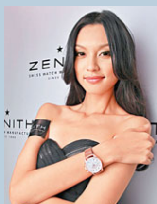
■模特兒獨愛Zenith全人手製造和100%的自家機芯設計。