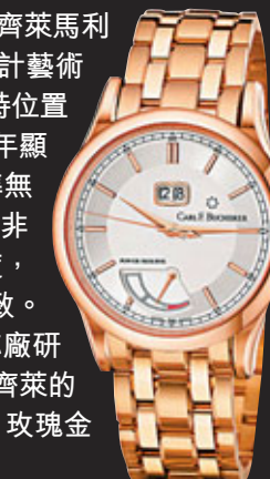
■寶齊萊馬利龍Big Date Power腕錶

對鍾情萬年曆工藝的錶迷來說，寶齊萊馬利龍萬年曆計時碼錶（左圖）可謂時計藝術的典範：12時位置的日期顯示、6時位置的星期顯示、9時位置的月份及閏年顯示，以及3時位置的月相百年精準無誤，這枚寶齊萊獨有的機芯更兼具非凡計時功能，錶盤外緣有測速計刻度，與品牌堅守以實用功能為本的理念一致。馬利龍萬年曆計時碼錶以Vaucher機芯廠研製的機芯為基礎，但細節修飾則秉承寶齊萊的一貫本色。精鋼型號限量發行150枚，玫瑰金型號全球僅100枚。