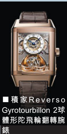
■積家Reverso Gyrotourbillon 2球體形陀飛輪翻轉腕錶

瑞士頂級鐘錶製造廠Zenith真力時共獲2,333項瑞士天文台測時大獎，享有真正的製錶專家之美譽。擁有146年的悠久歷史、297項專利，180款經典機芯類型，並由此研發出500種機芯款式，是世上少數具有完全自行設計、製造、生產所有機芯及鐘錶能力的品牌，獨愛它全人手製造和100%的自家機芯，極具收藏價值。