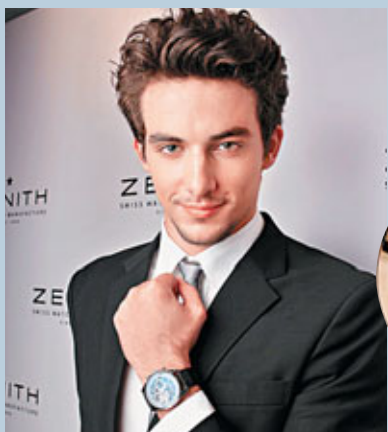
■模特兒手戴Zenith Chronomaster Open名錶。

從前，「金勞」是名錶的代名詞，戴上一枚金錶，是身份的象徵。然而，錶上的設計若只有金和鑽石，實在太單調乏味。其實，腕錶早已起革命，新的潮流款式不斷湧現。而且，戴錶跟穿衣服一樣，是每日必需的，戴上一隻靚錶，能夠掌管自己時間之餘，還能盡顯獨特個性，整個人都顯得格外醒神。今次，為大家介紹各種名錶，以備不同場合的需要。