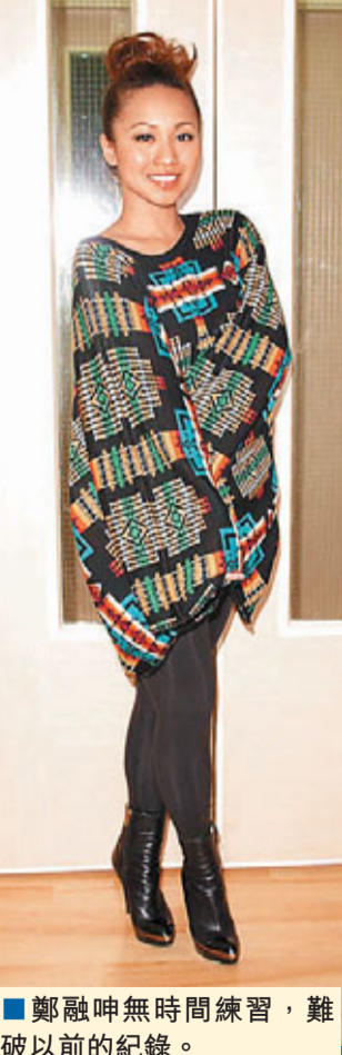
鄭融無時間練習，難破以前的紀錄。