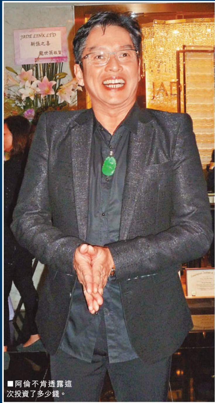
阿倫不肯透露這次投資了多少錢。