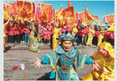
■日月潭上演三國會戰，「曹營」棄械敗陣。

香港文匯報訊 據台灣傳媒報道，寧靜優美的日月潭12日戰雲密布，原來是南投縣為慶祝辛亥百年，舉行宗教文化觀光節上演「三國會戰」戲碼，關公率百艘戰船渡湖大破曹營；兩軍在伊達邵碼頭兵戎相見時，麵包、法國麵包齊飛，趣味橫生。