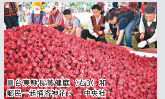
■台東縣長黃健庭(右3)和鄉民一起播洛神花。

據中社12日電 儘管在兩年多前的「88風災」中飽受摧殘，房屋倒塌的畫面至今仍令人觸目驚心，但是在離災不離村的堅持下，讓「洛神之鄉」的台東縣金峰鄉再度藉着綻放的洛神花，再度重新出發。為期9天的「2011台東金峰鄉洛神花季」，12日在「8大頭目長老」祈禱祝禱下揭開序幕。主辦單位還搭配一系列的旅遊套裝行程，帶領民眾遠離都市塵囂，享受洛神花之美。