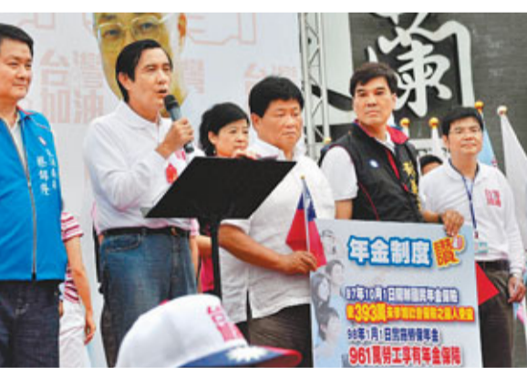
■馬英九(左2)向勞工團體談執政3年來的政績。

至於歐債所引發的全球金融危機，導致島內部分科技廠休無薪假，馬英九則強調，經建部會評估，對台