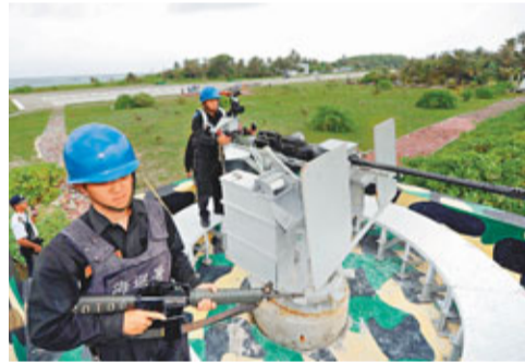
■駐守太平島的台灣海巡人員。

香港文匯報訊 據台灣傳媒報道，南海最近幾年情勢緊張，部分人士主張派遣台軍駐守南沙群島的太平島；對此，台灣當局領導人馬英九在最新一期《治台週記》中表示，台灣愛好和平，南沙的情勢要注意，但是也不必過度反應，目前駐守太平島的海巡署人員，應該可以扮演好「和平締造者」的角色。