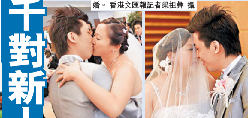
■本港昨日有1017對新人結婚。