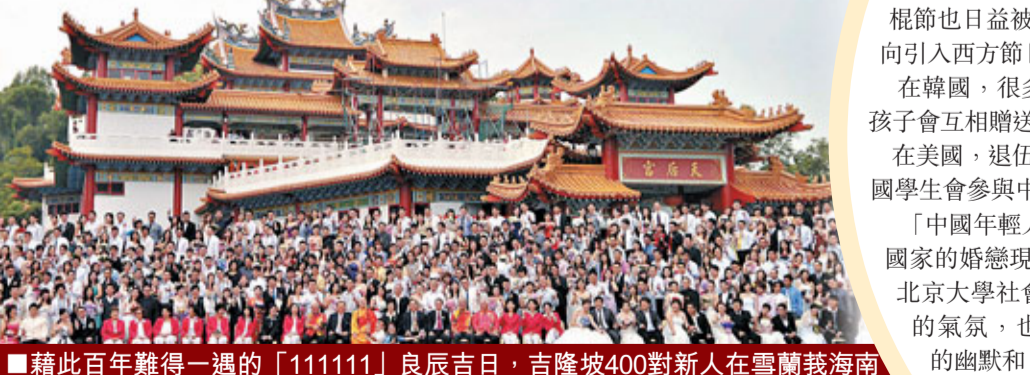
■藉此百年難得一遇的「111111」良辰吉日，吉隆坡400對新人在雪蘭莪海南會館（天后宮）的集體註冊儀式上共結連理。

據新華社11日電 每年的11月11日被中國年輕人稱為「光棍節」，因為「1」形似一根棍子，而「光棍」在中文裡是「單身」的另一種說法。上世紀90年代，一群南京高校的年輕人約定將這一天稱為「光棍節」。 隨着「剩男剩女」現象成全球性社會問題，這個完全發源於中國校園的趣味節日，如今被越來越多的外國人關注、認可、參與，不少在華外國人踴躍參加光棍節活動，光棍節也日益被海外關注、接受，打破從前中國年輕人幾乎是單向引入西方節日的局面。 在韓國，很多年輕人都知道中國有個光棍節，這天，韓國女孩子會互相贈送禮物或者一起吃巧克力棒。 在美國，退伍軍人節正好和光棍節同一天，全美放假。不少外國學生會參與中國留學生們組織的光棍節活動。 「中國年輕人創立的『光棍節』，契合了較為普遍存在於不同國家的婚戀現狀，以及人們在社會壓力下尋找慰藉的心態。」北京大學社會學教授夏學鑾表示，光棍節瀰漫着紀念、喜慶的氣氛，也暗含着一定程度的幽默和自嘲色彩。