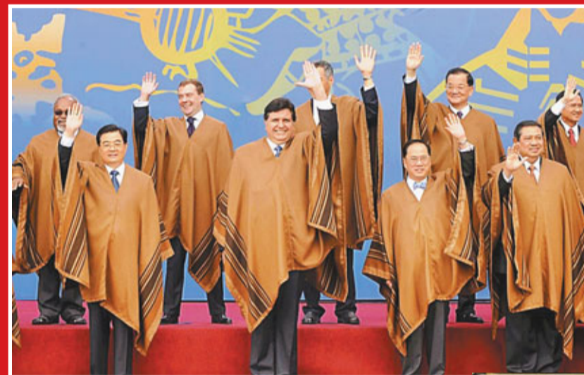
■在2008年秘魯利馬舉行的第16屆APEC經濟領導人會議閉幕前，曾蔭權穿上秘魯傳統斗篷，與國家主席胡錦濤等合照。

美國商會、陶氏化學、聯邦快遞、微軟公司、普華永道、沃爾瑪集團、摩根大通、強生集團等美國企業和機構的代表參加會見。