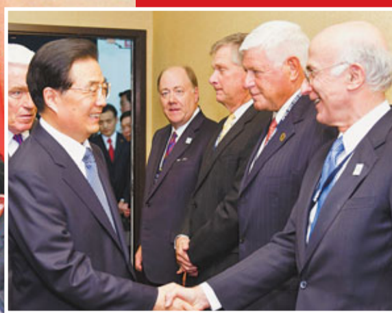
■胡錦濤與美國工商界人士握手。