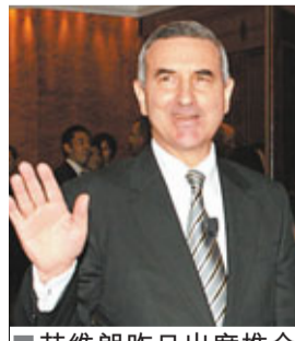
艾維朗昨日出席推介會。

香港文匯報訊(記者 涂若奔)電訊盈科(0008)分拆旗下電訊業務HKT(6823),昨日舉行投資者推介會,吸引到包括摩根大通在內的不少機構參與。銷售文件指,HKT將於全球發行20.53億股份單位,當中10%於本港發行,每手買賣單位為1000股。該股將於本月16-21日公開發售,22日定價,29日正式掛牌。