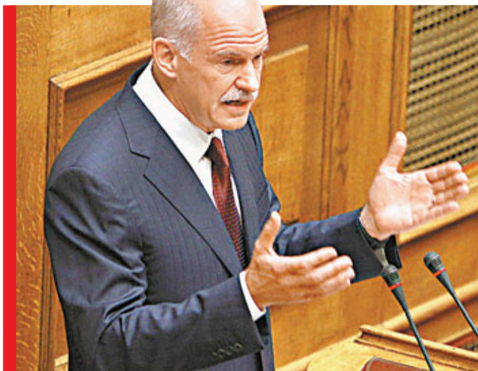
■希臘總理帕潘德里歐早前突然宣布透過公投決定是否接受歐盟紓困援助，引起軒然大波。資料圖片