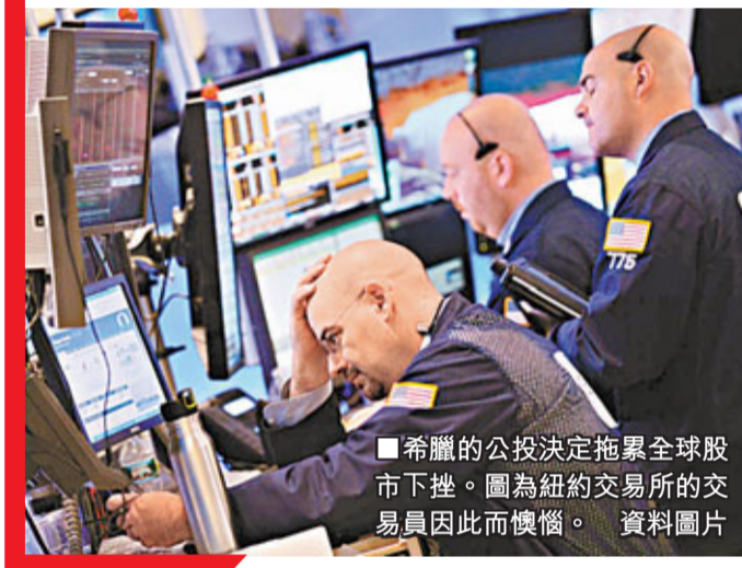
■希臘的公投決定拖累全球股市下挫。圖為紐約交易所的交易員因此而懊惱。資料圖片