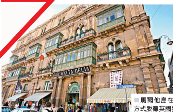
■馬爾他島在1965年以公投方式脫離英國獨立。資料圖片