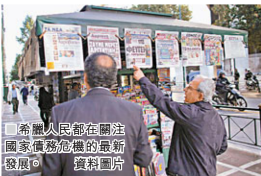
■希臘人民都在關注國家債務危機的最新發展。資料圖片

直接反映民情 無論政府或議會，即使是由選舉產生，也未必一定能緊握民情，有時更可能因各種利益而違背民意。在非選舉年間，民意調查作為最常用的民情掌握工具之一，都受到媒體報道、抽樣誤差及問卷設計等因素所局限，未能確實反映民情。因此，有人指出，公投是全民較直接表達意願的方法之一。