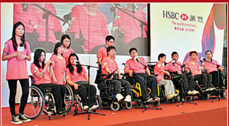
慈善基金捐助肢體殘障人士,讓他們克服身體的障礙,重燃生命光彩。

滙豐銀行慈善基金於1981年成立,一直積極透過捐款、與社福機構合作和員工的參與,為本地以至內地開拓多元化的教育、環保和社區服務。為慶祝慈善基金成立30周年,滙豐於6月展開一連串的慶祝活動,以「啟動潛能 點亮人生」為主題,鼓勵廣大市民發揮潛能,並頌揚各界人士的卓越成就。