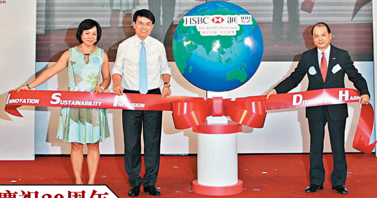
(左起)滙豐亞太區企業可持續發展總監區佩兒、環境局局長邱騰華、勞工及福利局長張建宗等主禮嘉賓,為滙豐銀行慈善基金30周年展覽主持揭幕儀式。