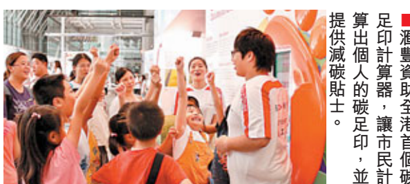
滙豐資助全港首個碳足印計算器,讓市民計算出個人的碳足印,並提供減碳貼士。

此外,慈善基金亦透過社區發展計劃,資助一些在香港社區進行的小型公益計劃。基金的工作同樣獲得滙豐員工支持,每年員工付出數萬小時,以個人或小組方式參與公益服務,冀為社會共建和諧美好明天。