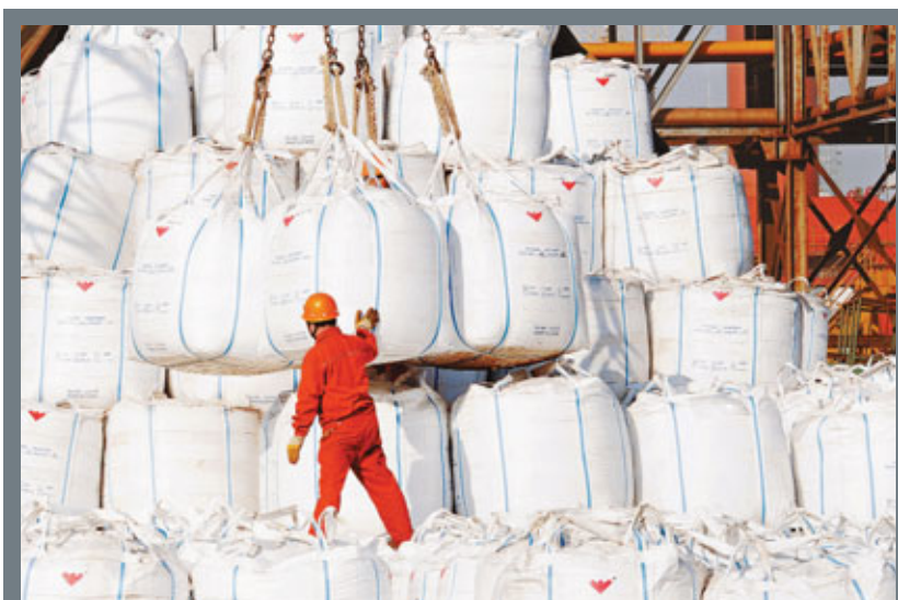
海關總署數據顯示,受累於外需疲軟,內地10月出口較同期增長15.9%,較9月放緩1.2個百分點,差過市場預期。圖為江蘇連雲港碼頭工人正在裝卸貨物。

在與主要貿易夥伴的雙邊貿易中,中國對歐美日傳統市場增速減緩,對新興市場國家貿易增長強勁。據海關統計,前10個月,中美雙邊貿易總值為3,630.3億美元,增長16.8%。同期,中國與東盟雙邊貿易增長25.7%,高出同期中國進出口總額增速1.4個百分點。其中,對東盟貿易逆差211.7億美元,擴大59.2%。另外,前10個月中