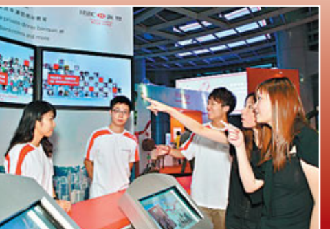
「我的香港」攤位呼籲香港市民攜手建設和諧共融、創新及可持續發展的香港。