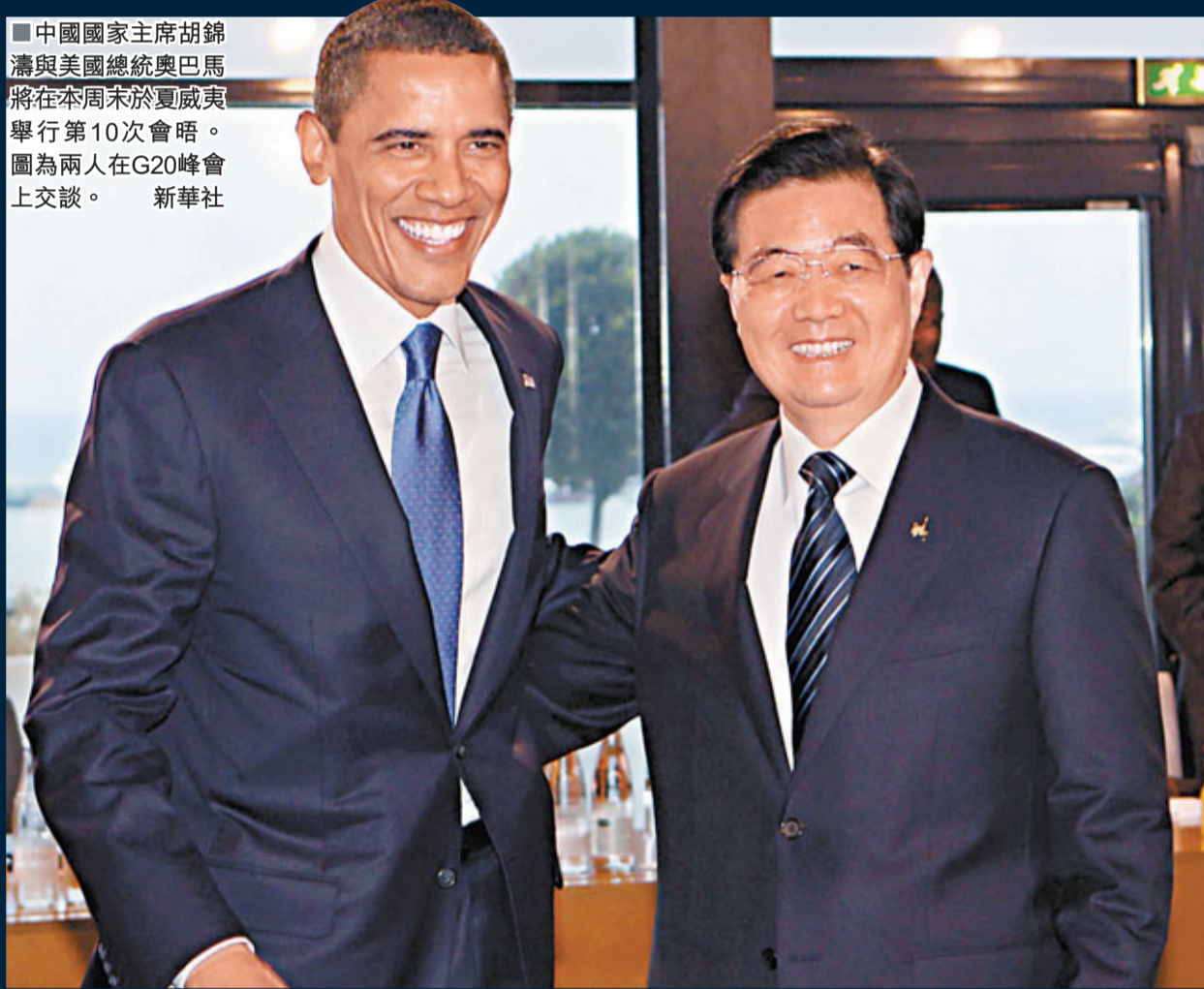
■中國國家主席胡錦濤與美國總統奧巴馬將在周未於夏威夷舉行第10次會晤。圖為兩人在G20峰會上交談。