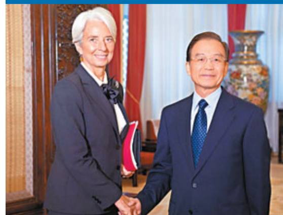
■國務院總理溫家寶10日會見國際貨幣基金組織總裁拉加德。

香港文匯報訊(記者 何凡 北京報道)國務院總理溫家寶10日在中南海紫光閣會見IMF總裁拉加德時表示,中方將繼續以開放的態度,參與和推進IMF各項改革,使其在危機救助、監督和協調各國宏觀經濟政策、維護全球穩定方面,發揮更加積極的作用。同日,國家副主席習近平在人民大會堂會見拉加德。雙方就全球經濟和中國經濟形勢等共同關心的問題交換了意見。拉加德表示,她與中國討論過以雙邊方式援助歐洲的可能性,但目前不做評價。