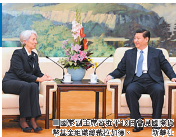
■國家副主席習近平10日會見國際貨幣基金組織總裁拉加德。

拉加德稱,中國經濟保持平穩較快增長,對世界穩定和發展具有不可替代的重要意義。IMF將與各國合作落實G20峇納斯峰會公報的內容,攜手應對當前危機。此外,拉加德10日在北京發佈會上向記者表示,歐債