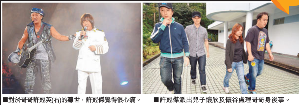
■對於哥哥許冠英(右)的離世，許冠傑覺得很心痛。 ■許冠傑派出兒子懷欣及懷谷處理哥哥身後事。

香港文匯報訊 (記者 梁靜儀、蔣焯文) 綽號「雞泡」的著名喜劇演員許冠英，因心臟病發，前晚在九龍塘寓所被助手揭發猝死，終年65歲。歌神許冠傑兩子懷欣及懷谷，昨日與二伯父許冠武同到沙田富山殮房認屍，心情沉重，表示已向法醫官提出不解剖遺體的要求。由於許冠英生前無宗教信仰，家人稍後會商討以何種形式舉行喪禮。對於「雞泡」的離世，曾合作過的藝人如楊千嬅、鄭中基、廖碧兒等都依依不捨，而廖碧兒更一時感觸，忍不住當場灑淚。