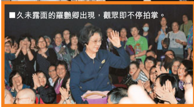
■久未露面的羅艷卿出現，觀眾即不停拍掌。