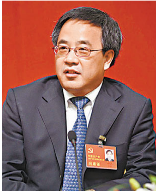
■內蒙古自治區黨委書記胡春華。

內蒙古自治區經濟增長雖然連年穩居國內之首，但城鎮居民、農牧民平均收入卻低於國內平均水平。內蒙古自治區黨委副書記、自治區主席巴特爾在今年6月1日出