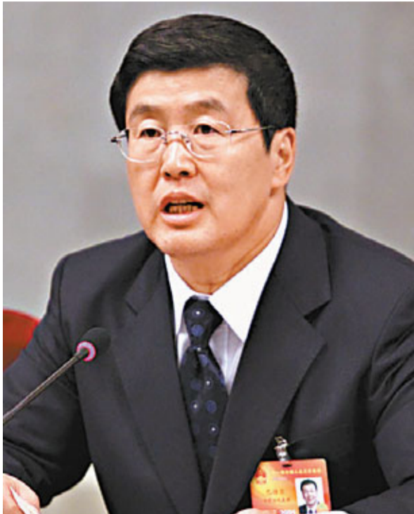
■內蒙古自治區主席巴特爾。

巴特爾年富力強，學識淵博。巴特爾曾在日本東京研修中心學習經濟管理，是少數民族官員中難得一見的學者型官員。內蒙古的發展成就喜人，少不了他多年的努力和汗水。巴特爾生在內蒙古、長在內蒙古，長期工作在內蒙古，對內蒙古的各族人民有着深厚感情。巴特爾表示，內蒙古自治區黨委、政府高度重視經濟發展不平衡的問題，今後將加大對農牧業的扶助和投資，真正實現「強區與富民並重」。2009年底，內蒙古果斷地把發展戰略由「強區富民」調整為「富民與強區並重、富民優先」。