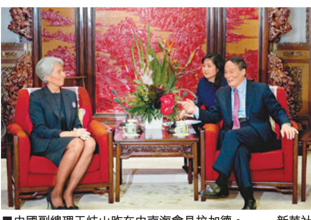
中國副總理王岐山昨在中南海會見拉加德。

香港文匯報訊(記者 何凡、海巖 北京報道)國際貨幣基金組織(IMF)總裁拉加德上任後首次訪華。她指出，全球經濟存在下滑風險，中國是全球增長的關鍵動力，但若僅靠中國努力，不可能抑制金融危機和歐債危機。她指出，全球發達國家肩負起恢復增長與信心的重任，否則，全球將陷入需求崩潰的惡性循環，最終或面臨低增長、高失業的「迷失十年」。 拉加德昨日在北京出席「國際金融論壇2011年全球年會」時認為，「中國正處於經濟發展的上升通道之中」。由於中國具備充足財政空間和迅速調撥資源的能力，若增長前景顯著惡化，財政政策可成為第一道堅固防線。此外，中國仍有空間通過貨幣政策控制信貸增長。 另據中國人民銀行官網消息，行長周小川於昨日與拉加德會面，雙方就全球經濟和中國經濟形勢、IMF的作用和國際貨幣體系改革等議題交換意見。