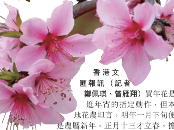
香港文匯報訊(記者 鄭佩琪、曾雁翔)買年花是逛年宵的指定動作，但本地農壇坦言，明年一月下旬便是農曆新年，正月十三才立春，擔心「春不來、花不開」，年宵期間未必有「靚花」應市，現要想法催谷。花商表示，今年受通脹、港元貶值、來貨漲價等因素影響，預告年宵花價增加10%至15%。

12檔無人吼 50檔賣底價 香港文匯報訊(記者 鄭佩琪、曾雁翔)維園年宵3個熟食檔的成交價呈兩極，下午的濕貨攤檔競投較激烈，但仍出現「有檔無人要」的現象，昨日拍賣180個濕貨攤檔，經兩輪競投後，最終有12個攤檔「乏人問津」而須收回，數目是2010年以來最高。另有約50個攤檔以底價8,410元售出。有花商估計，明年農曆新年較往年提早一個月，年花未必「如期」開花，小型花商不敢貿然出手競投。 老手出口術 行家終讓路 根據經驗，參與維園年宵濕貨攤檔競投者，主要都是花市「老手」，大都互相認識，知己知彼，