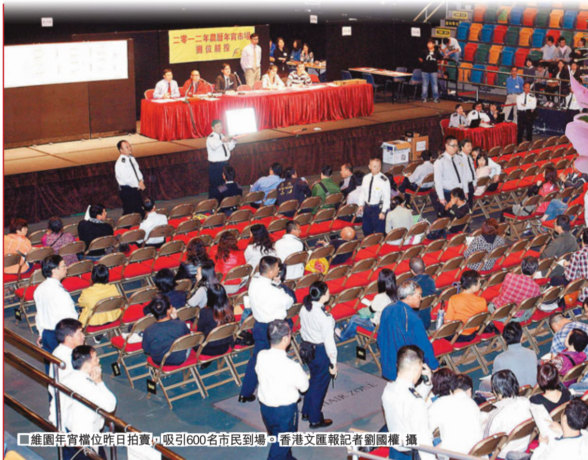
維園年宵檔昨日拍賣，吸引600名市民到場。

香港文匯報訊(記者 曾雁翔、鄭佩琪)被視為明年經濟指標的宵攤檔，昨日展開首場競投，率先推出的是維園的熟食及濕貨攤檔。全日重頭戲的熟食「檔王」成交價創出新高，以51萬元成交，較去年升34%；其餘2個面積較小的熟食檔位則由兩名新手分別以34.5萬及21萬元投得，分別跌價5.5%和25%。「檔王」得主相信，市民獲港府派發的6,000元，逛年宵時會豪爽，期望開個紅盤。濕貨攤位總成交額則跌價近一成。乾貨攤位今天競投。