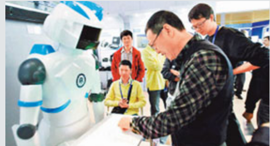
觀眾與深圳研製的「下棋機器人」對弈。