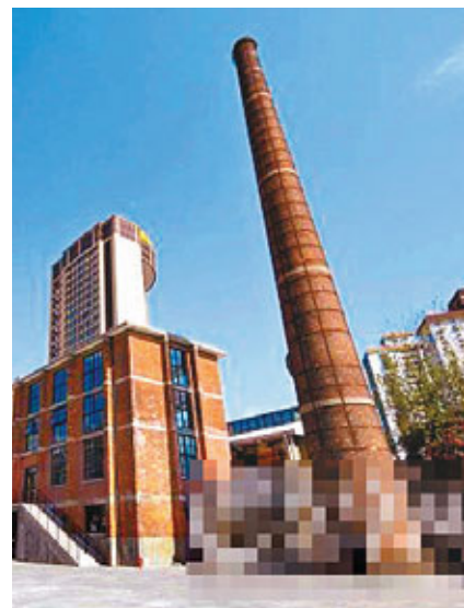
上海創意產業區活化老工廠。網上圖片

香港文匯報訊(記者 錢修遠 上海報導)獲得國際競爭力中心授權,設在上海交通大學的國際競爭力中心亞太分中心研製並發佈了今年的亞太知識競爭力指數。據了解,在亞太經濟較發達的33個地區中,按知識競爭力指數排名,東京、台灣、愛知位居前三,中國香港排在第20位,內地的上海、天津、北京分列第18、21和22位。