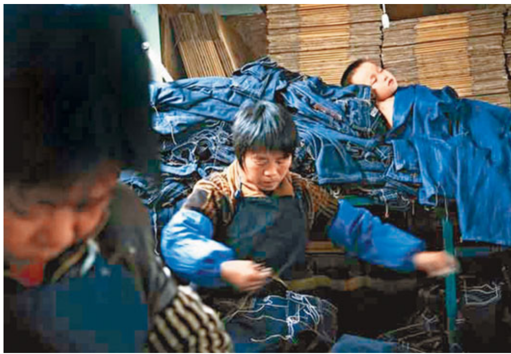
內地血汗工廠的一角,女工深夜趕工。

藍皮書指出,2011年,國有企業的社會責任指數(31.7分)仍領先於民營企業(13.3分)和外資企業(12.6分)。其中,國務院國資委監管的中央企業進步最大,外資企業其次,民營企業略有退步。社科院認為,除了中央企業基礎較好以外,國務院國資委的積極推動也發揮了重要作用。其他國有企業的社會責任發展水平偏低,與此類企業缺乏統一的外部推動力量有關。