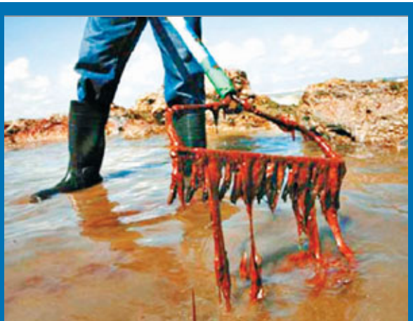
渤海蓬萊油田漏油造成嚴重環境污染。

藍皮書指出,2011年度中國境內外資企業100強的社會責任整體水平較低,仍在旁觀。沒有出現社會責任領先者企業;有6家企業處於追趕者階段;16家企業處於起步者階段;78家企業處於旁觀者狀態,沒有採取實質性的責任管理措施,也未向社會披露相關的責任信息。在被調查的國企、民企和外企共300家企業中,有26家得分為0分或負分。這26家企業中,外資企業佔19家,阿迪達斯、戴姆勒、克萊斯勒、可口可樂3家外企得分負分,其中阿迪達斯(中國)有限公司最低,得分是-4分。