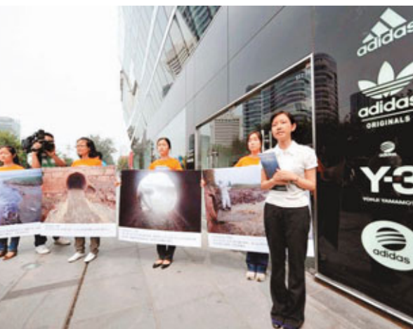
阿迪達斯因工廠排水污染環境遭到抗議。

話你知 企業社會責任(英文:Corporate Social Responsibility,簡稱CSR)是指企業在創造利潤、對股東利益負責的同時,還要承擔對員工、對社會和環境的社會責任。一般認為,CSR包括:一是好的公司治理和道德標準,包括遵守法律,防範腐敗賄賂,以及商業原則問題等;二是對人的責任,包括員工安全計劃、就業機會均等、反對歧視等。三是對環境的責任,包括維護環境質量,使用清潔能源,共同應對氣候變化和保護生物多樣性等;四是對社會發展的廣義貢獻,主要指廣義的對社會和經濟福利的貢獻,比如向貧困社區提供幫助等。