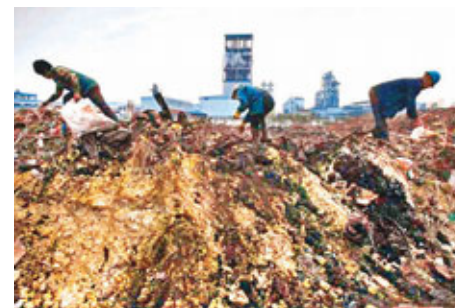
長江沿岸成不少工廠的毒廢料排放處。

香港文匯報訊(記者 趙一存 北京報導)據環保部網站消息,中國環境保護部部長周生賢7日在主持召開環保部常務會議時透露,「十二五」期間,中國將實施重點流域水污染綜合防治戰略,努力恢復江河湖泊的生機與活力,促進流域經濟社會的可持續發展。