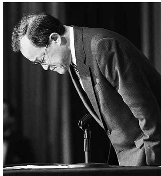
奧林巴斯社長高山修一在記者會鞠躬致歉。