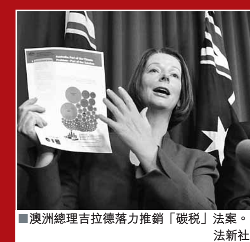
澳洲總理吉拉德致力推銷「碳稅」法案。

澳洲總理吉拉德政府提出的「碳稅」法案，在國內引起極大爭議。澳洲國會昨日終於通過法案，定於明年7月正式開始徵稅。分析人士認為，這是吉拉德擔任總理以來力排眾議取得的「最大成功」，使澳洲終於避免在下月氣候變化大會空手赴會的尷尬局面。執政工黨上下都為此來之不易的勝利歡呼。然而成本將因此增加，或打擊中國企業等外資投資澳洲資源行業的意願。