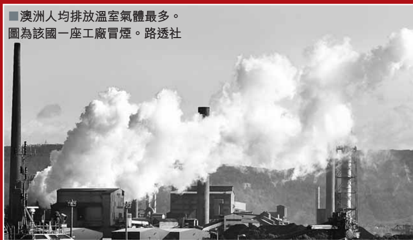
澳洲人均排放溫室氣體最多。圖為該國一座工廠冒煙。

澳洲總理吉拉德政府提出的「碳稅」法案，在國內引起極大爭議。澳洲國會昨日終於通過法案，定於明年7月正式開始徵稅。分析人士認為，這是吉拉德擔任總理以來力排眾議取得的「最大成功」，使澳洲終於避免在下月氣候變化大會空手赴會的尷尬局面。執政工黨上下都為此來之不易的勝利歡呼。然而成本將因此增加，或打擊中國企業等外資投資澳洲資源行業的意願。