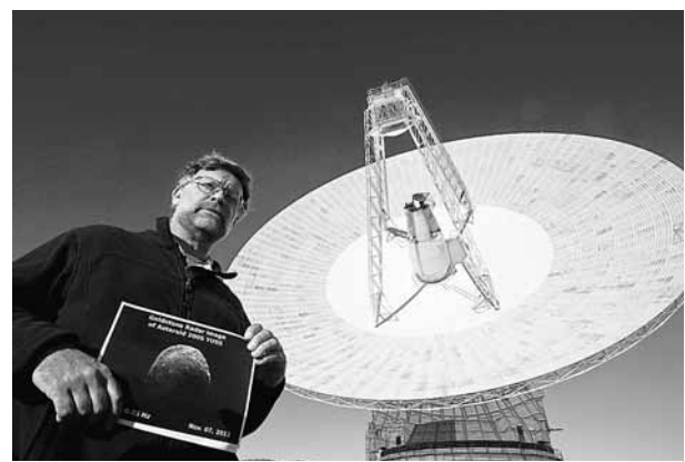
美國科學家展示「2005 YU55」的小行星的近照。

一顆航空母艦大小的小行星昨日與地球擦肩而過，距離地球只有月球的8/10，是30年來首次有如此巨型的小行星近距離掠過地球。科學家密切追蹤，希望小行星有助解開宇宙起源之謎。