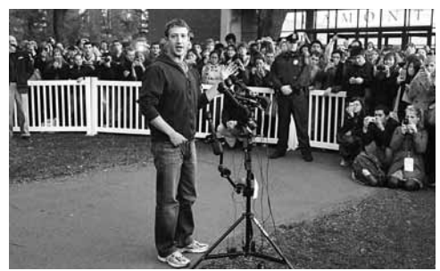
朱克伯格在哈佛大學回答提問。

Facebook創辦人兼行政總裁朱克伯格前日返母校哈佛大學，是他自2004年中途輟學以來，首度重返母校，大受一眾「師弟妹」歡迎，哄動情況恍如搖滾巨星駕臨，他並公布將在哈佛招聘新血。此外，朱克伯格接受媒體訪問時，透露不急於進軍中國，又稱社交媒體對「阿拉伯之春」的影響力被高估了。