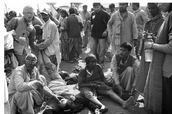
人踩人慘劇現場，部分教徒證實死亡。

印度北部北阿肯德邦的宗教聖地赫里德瓦爾昨日舉行宗教活動時，發生人踩人事件，造成至少16人死亡，另有20多人受傷。當局表示，預計死亡人數將繼續上升。