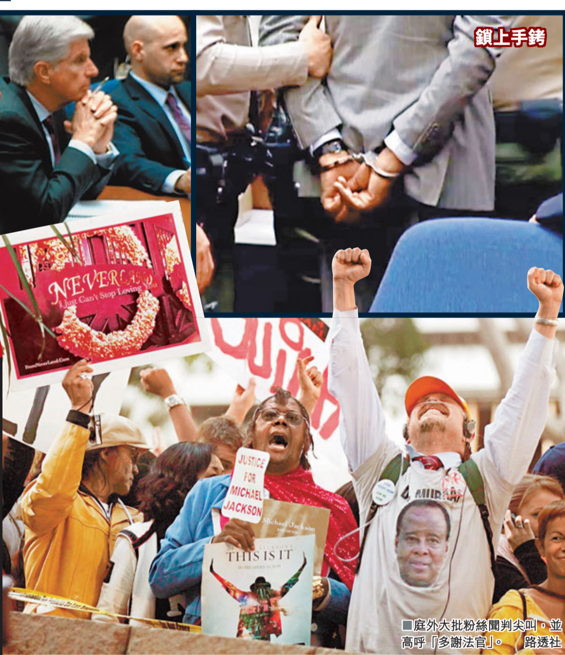
■庭外大批粉絲聞判尖叫，並高呼「多謝法官」。路透社

■MJ姊姊托雅在twitter留言，指要「所有人」繩之以法，明指MJ之死是陰謀。■《每日電訊報》