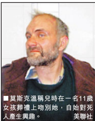
■莫斯科溫稱兒時在一名11歲女孩葬禮上吻別她，自始對死人產生興趣。