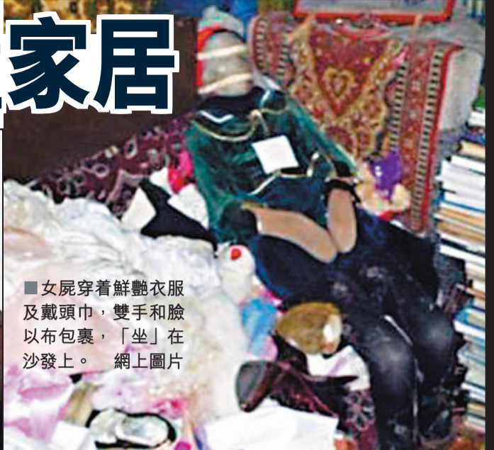
■女屍穿着鮮艷衣服及戴頭巾，雙手和臉以布包裹，「坐」在沙發上。