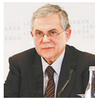
前歐洲央行副行長帕帕季莫斯將成為新總理。