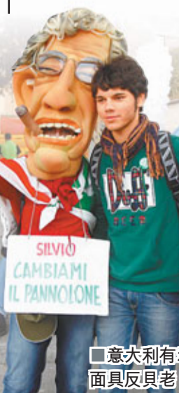
意大利有示威者戴上面具反貝老。

國債孳息率逼近7厘 當年希臘、葡萄牙及愛爾蘭均在孳息率升至7厘的心理關口時向外求援。意大利國債孳息率昨日早段升至6.73厘，距離7厘愈來愈近，投資者大舉拋售意國債，明顯反映市場的不信任，分析指出，意大利國債風險加劇，對銀行的吸引力大減，將形成惡性循環，進一步嚇退買家。意大利債務多達1.9萬億歐元(約20.3萬億港元)，當中2,000億歐元(約2.1萬億港元)將在明年到期，該國根本無法承受如此高的孳息率。 路透社/法新社/彭博通訊社/《華爾街日報》