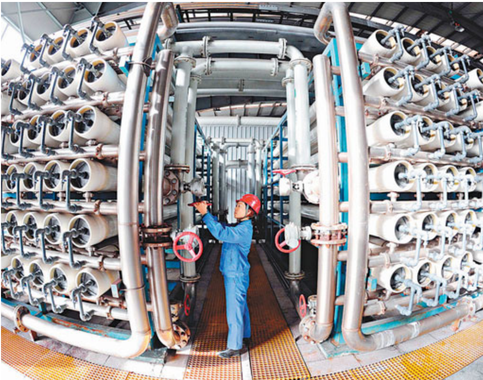
■太鋼大力發展綠色經濟，積極探索低能耗、高技術的綠色工業發展之路。圖為在太鋼污水處理作業區。

規劃並指出，2015年內地粗鋼導向性消費量約為7.5億噸，並預計「十二五」期間鋼鐵行業總體上將呈現低增速、低盈利的運行態勢。規劃稱，中國粗鋼需求量最高峰或出現在2015年-2020年期間，峰值約7.7-8.2億噸。同時，「十二五」末將基本建立利益共享的鐵礦石、煤炭等鋼鐵工業原燃料保障體系，新