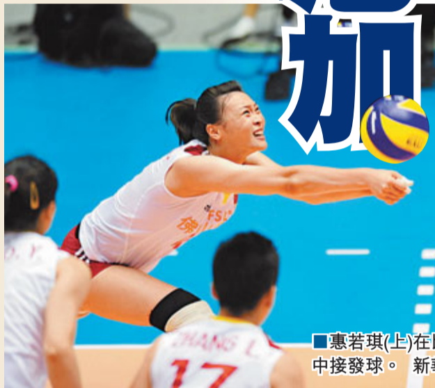
惠若琪（上）在比賽中接發球。