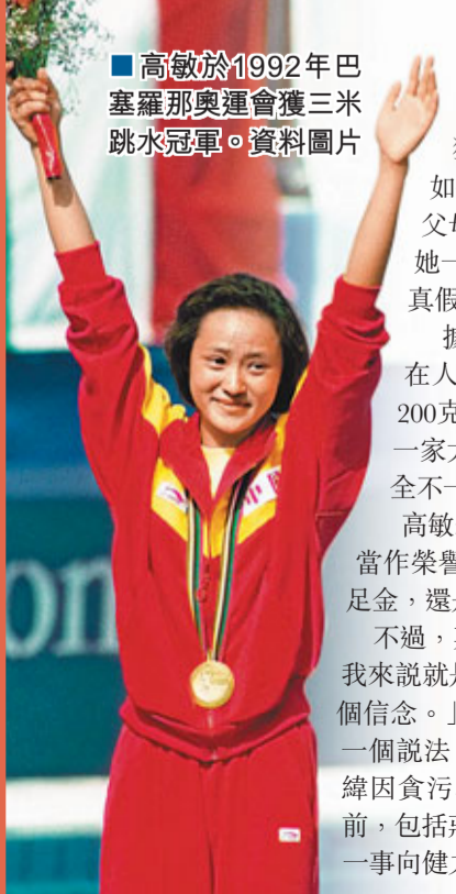
高敏於1992年巴塞羅那奧運會獲三米跳水冠軍。資料圖片

據新華社北京7日電 日前，1992年巴塞羅那奧運會柔道冠軍莊曉岩稱健力寶集團當年獎勵給她的純金易拉罐涉嫌造假，同樣獲得純金易拉罐的「跳水女皇」高敏的反應如何呢？她顯得很灑脫，稱奧運金罐一直存在父母家裏，她不希望去打擾家人的安寧；另外她一直把金罐當作榮譽，從來沒有考慮過它的真假。