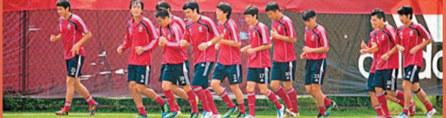
國足臨行前如常訓練。