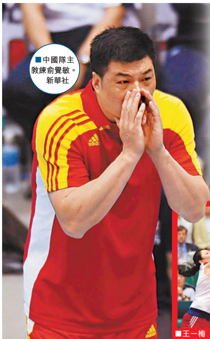
中國隊主教練俞覺敏。新華社