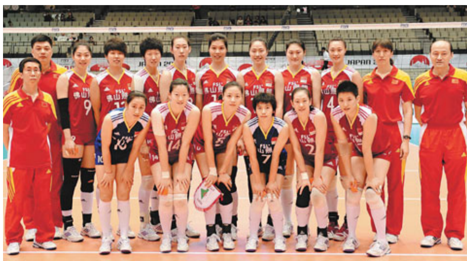
中國女排將在餘下賽事面臨更多硬仗。

據東方網消息，結束了連續兩天的五局苦戰後，中國女排終於7日迎來一天難得的休養日。但姑娘們並沒有閒着，而是如常進行訓練，上午力量訓練，下午場內訓練。其中下午的訓練主要以進攻輪次、模擬對性攔網和防反以及接發球訓練為主。