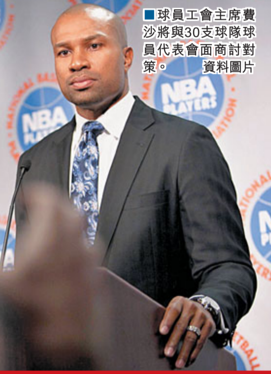
球員工會主席費沙將與30支球隊球員代表會面商討對策。資料圖片