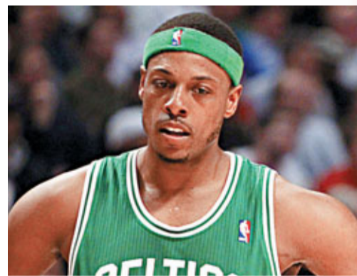
皮雅斯帶頭要解散工會。資料圖片