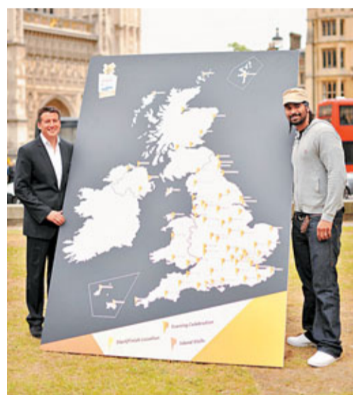
倫敦奧運火炬將傳遍英國74地。資料圖片