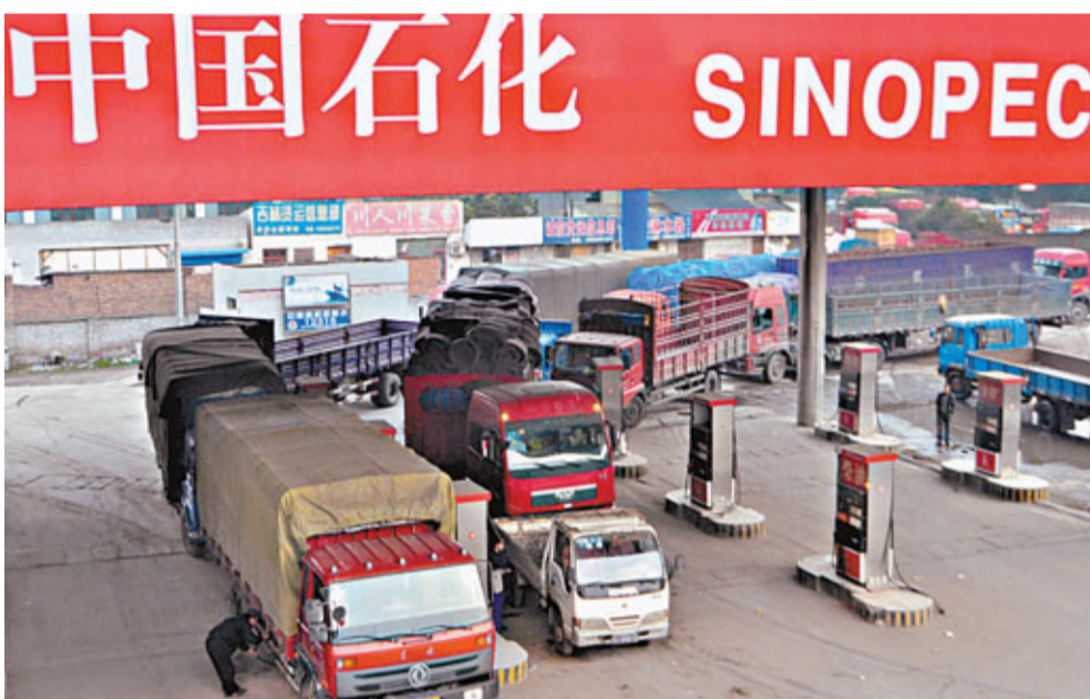
中石化在2009年以近73億美元收購Addax石油公司。

中國企業對外投資剛起步十多年，總體基數仍低，無法與傳統的投資大國，如美國、歐盟國家、日本等，相提並論。據統計，2010年中國對外直接投資存額僅相當於美國的6.5%，英國的18.8%，法國的20.8%，德國的22.3%。2010年，中國對外直接投資僅分別佔全球當年流量、存量的5.2%和1.6%。然而，中國對外投資的亮點在於其快速增長速度。