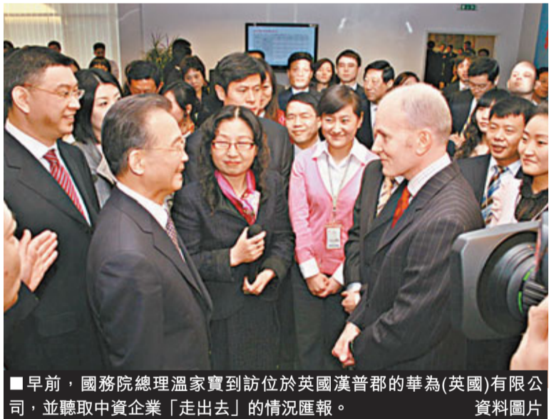
■早前，國務院總理溫家寶到訪位於英國漢普郡的華為(英國)有限公司，並聽取中資企業「走出去」的情況匯報。

十多年來，中國企業海外投資與併購開始蓬勃發展。2009年，中石化宣布，以近73億美元收購總部位於瑞士的Addax石油公司。這是迄今為止中國公司進行海外資產收購最大的一筆成功交易。據湯森路透集團發表的報告，2009年，在全球跨境併購規模同比下降35%的情況下，中國企業的海外收購總額同比增加40%。