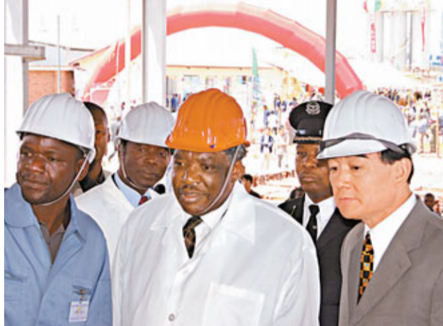
■贊比亞總統(中)在中國駐贊比亞大使李保東(右)陪同下參觀中國在非洲投資的首家銅冶煉企業。

中國企業需充分利用政策性貸款、創設海外基金以吸納社會資本、與東道國或第三國企業合資經營、利用國際化融資管道等各種方法，加強融資能力。中國企業還需大力加強對國際化人才的培養，通過企業內部培訓、面向國際招聘人才、積極吸引「海歸」等措施，提高企業人才的國際化水準。