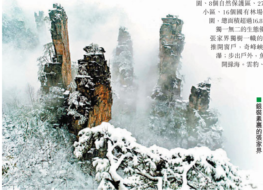
銀裝素裹的張家界

目前，張家界正在着力建設生態城市，正在努力形成有利於資源節約和環境保護的產業結構、增長方式和消費模式，正在積極探索發展低碳經濟。追求綠色發展，已經成為全市各行各業的共識。未來，環保、健康、綠色、低碳將成為張家界打造世界一流旅遊勝地的重要標誌。既要金山銀山，也要綠水青山，這就是張家界的發展宣言。