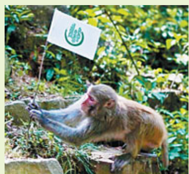
張家界國家森林公園內的獼猴是景區內一道特殊的風景

2010年，張家界景區接待中外遊客2405萬人次，實現旅遊收入125億元，過夜人數超過1000萬，接待入境遊客150萬人次，分別比上年增長了21.9%、24.8%和73%，連續多年領先中國同類旅遊城市。今年1-9月，接待人次和旅遊收入分別同比增長了42%以上，紀錄又一次刷新。