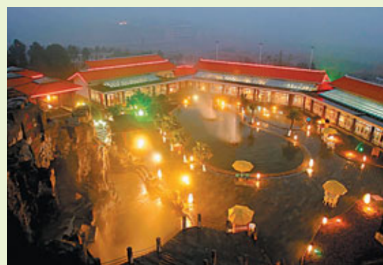
張家界市區及景區內各類高檔次酒店林立，是休閒度假的好去處。

按照規劃，當前張家界正以打造世界旅遊精品為目標，建設具有優良生態環境和特有文化氣質、綠色低碳、宜居宜遊的世界旅遊目的地。期望通過20年的努力，使張家界真正成為富有民族特色、能夠滿足度假休閒要求、包容性強、開放度文明度高的國際旅遊城市，以及國內外遊客休閒度假乃至旅居之地。同時，千方百計開拓國際旅遊市場，使張家界成為亞洲重要旅遊目的地，成為歐美等高端遊客喜歡的地方，加快實現入境旅遊佔到旅遊總量的30%以上，自助遊的比例佔到50%以上的客源市場結構目標。