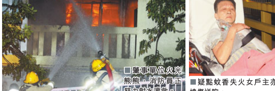
■肇事單位火光熊熊,消防員正努力射水灌救。