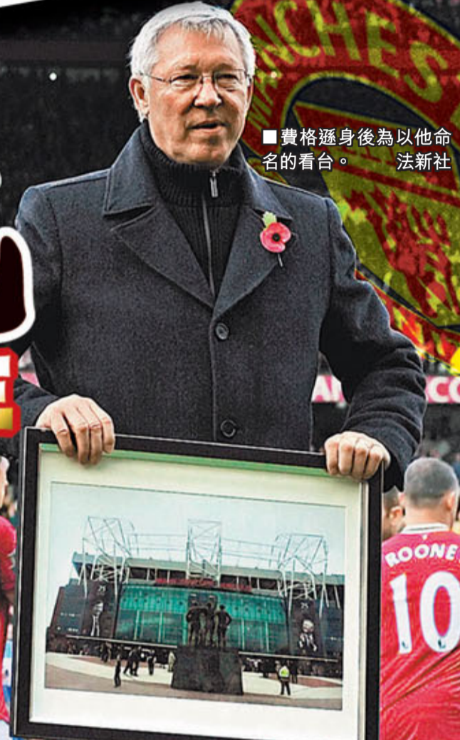
費格遜身後為以他命名的看台。法新社