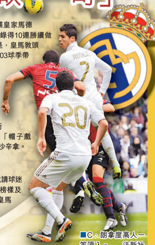
C·朗拿度高人一等頂入。