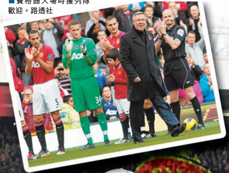
費格遜入場時獲列隊歡迎。

舊將布朗向費格遜送大禮！曼聯上周六於英超主場對新特蘭，靠舊將布朗的「烏龍球」小勝1：0，賀領隊費格遜「魔」25周年；今仗開賽前，當費格遜走出球場時，兩隊球員和當值球證都列隊歡迎他，球場響徹了震耳的掌聲，曼聯更把奧脫福球場的北看台命名為阿歷士·費格遜爵士看台，感激費格遜一直以來的貢獻。