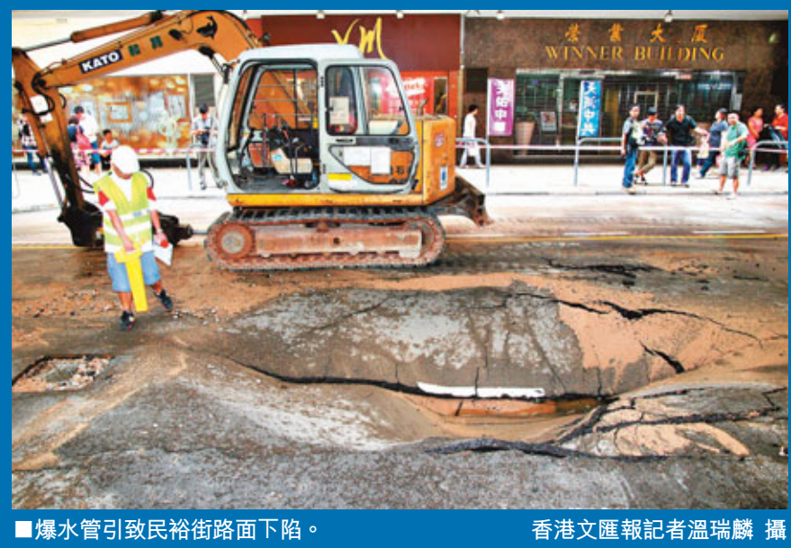
爆水管引致民裕街路面下陷。