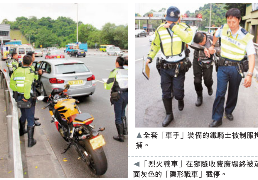
▲全套「車手」裝備的鐵騎士被制服拘捕。

其他鐵騎交警接報後加入追截行列,有警員則在各主要幹道設置路障截截,雙方追逐近10公里,至獅子山隧道收費廣場,「烈火戰車」終被截停,「隱形戰車」期間意外撞擊受損,一名警員受輕傷。57歲疑人姓周,稍後連人帶車被帶返警署扣查。案中成功追截「烈火戰車」的「隱形戰車」,為警隊最新購入的13輛寶馬535i旅行車之一,價值約80萬元,汽缸容量3千cc,由起步加速至100公里僅需6.1秒,對付超速駕駛甚至非法賽車綽綽有餘。