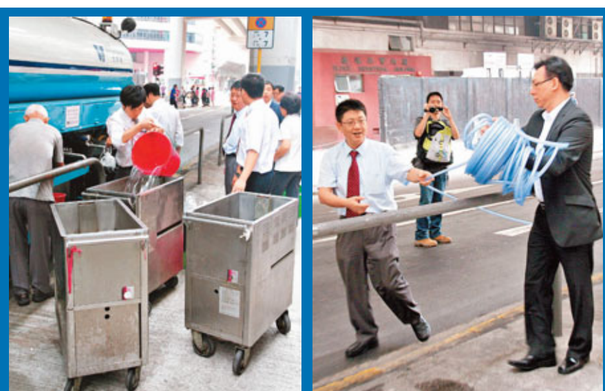
酒樓負責人買長達600呎膠喉接駁街喉取水應用。

水務署長馬利德上月曾表示,本港爆水管的宗數由10年前的2,000多宗,減至去年600宗,情況已大為改善,而滲漏率亦下降了5%。