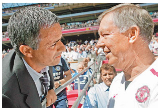
摩連奴(左)跟費Sir惺惺相惜。

Sir：「阿歷士費格遜爵士是曼聯史上無與倫比的教練，阿歷士爵士是英格蘭足球史上無與倫比的教練。」執教了阿仙奴15年的雲加跟費Sir亦敵亦友，兩人間自然是英雄惜英雄。他說：「毫無疑問他(費格遜)是非凡卓越的，因為我找不到第二個人，能在同一間球會連續25年都保持着頂尖的水準，而且毫無疑問，今後也不會再有人可以複製他的豐功偉績。」