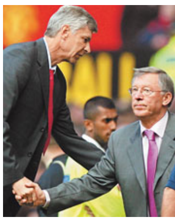
費格遜與雲加(左)亦敵亦友。