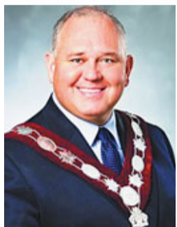
萬錦市薛家平下令展開獨立調查。

在加拿大大多倫多華人聚居的萬錦市，一個政府舉辦的兒童夏令營爆醜聞。一個名為「你會為得到一杯雪糕做什麼？」的遊戲，竟讓兒童做出種種令人髮指的粗鄙行為，包括有女孩舔男輔導員腳趾甚至馬桶內壁，家長得悉後大為震驚。《多倫多星報》報道，市長薛家平承認有此事，涉及38名營友，他解釋遊戲本不應按照當日的方法來玩，並下令展開獨立調查。