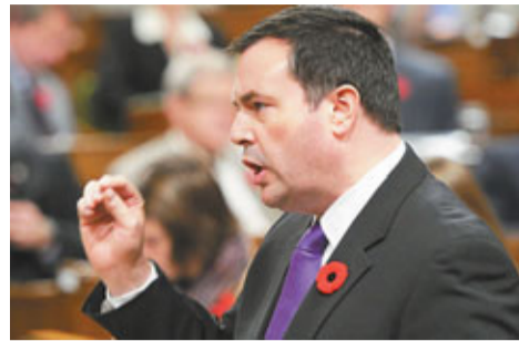
移民部長肯尼指目前等候批准的父母祖父母移民申請達17萬個案。

加拿大移民部長肯尼日前宣布，為減少移民申請個案積壓，由即日起停止父母祖父母移民申請2年，以10年期多次入境的「超級簽證」取代，最長停留期限可達2年。移民的父母及祖父母持這種簽證，仍可隨時到加國探望子女。移民部明年也將加速審核積壓的申請個案，估計約2.5萬名父母祖父母移民申請可獲批。