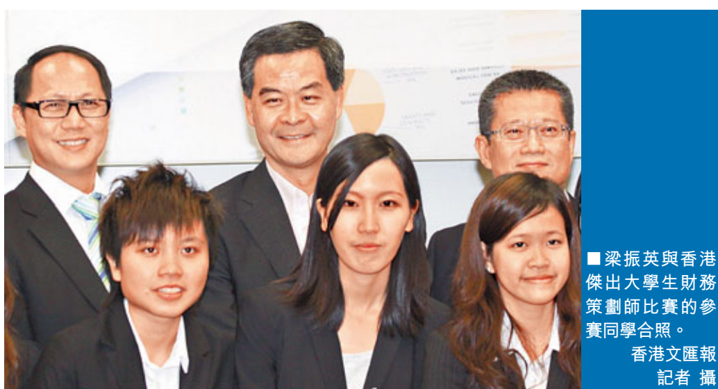
梁振英與香港傑出大學生財務策劃師比賽的參賽同學合照。

他並以一件往事，為同學們點出香港將來的發展方向：許久之之前，他帶著當時10歲的女兒參加一個香港的鋼琴比賽，同場有一位母親帶女兒由海口來港參賽，他在升降機內問對方為何特地帶女兒來港參賽，母親回答說：「香港的證書沒有假的。」這件事，令他聯想到香港