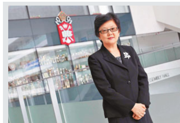
劉靳麗強調，如考生面試時能表現自然，即可突出本身優勢。