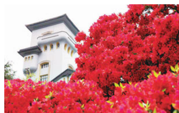
香港文匯報訊（記者 鄭治祖）香港禮賓府將於11月13日（星期日）上午10時至下午5時向公眾開放。市民可進入禮賓府的花園觀賞花卉樹木，及參觀行政長官在禮賓府舉行官方活動和接待賓客的地方。導賞員亦會在場向參觀人士介紹禮賓府的歷史及建築特色。

香港禮賓府是法定古蹟，受《古物及古蹟條例》保護。禮賓府通常每年開放2次。上一次開放日是今年3月20日，當日參觀人次超過5,000。