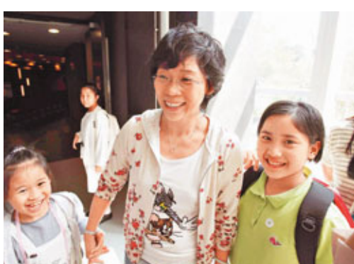
江太贊同女拔收生兼容不同社區學生需要。

女拔首階段報名日期由明天起至12月2日，申請者需親身將「學生個人資料概覽」表格，於辦公時間內交到學校，校方將於1月回覆申請結