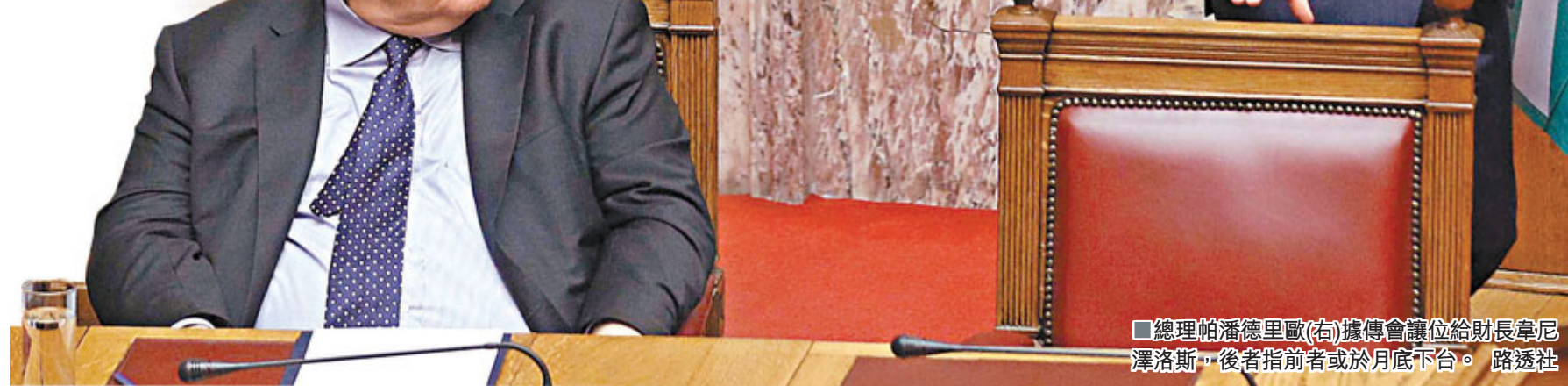
總理帕潘德里歐(右)據傳會讓位給財長韋尼澤洛斯，後者指前者或於月底前下台。

希臘國會昨日凌晨以153：145票，通過對政府的信任投票。總理帕潘德里歐此前承諾通過這關後，將立即開始就組建聯合政府談判，並願意討論由其他人領導新政府；分析指他只是「慘勝」。他沒透露何時下台，但有消息稱，他會讓位給財長韋尼澤洛斯。韋氏表示，聯合政府將執政至明年2月底，負責通過歐盟援助方案，其後舉行大選，帕氏或在本月底前下台。