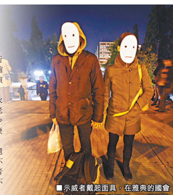
■示威者戴上面具，在雅典的國會外抗議總理玩政治鬧劇。路透社

一名失業逾1年的青年表示，民眾受緊縮折磨，帕氏還在國會上微笑，稱公投計劃是個笑話；他怒說：「現時不是說謊笑話的時候，他不能拿民生來開玩笑。」有示威者稱民眾已對政府絕望，不論執政社會黨或是新民主黨也不可靠，批評議員只會自保。■路透社/《華爾街日報》