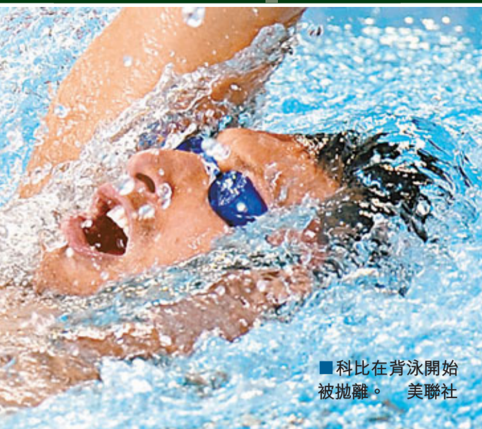
科比在背泳開始被拋離。