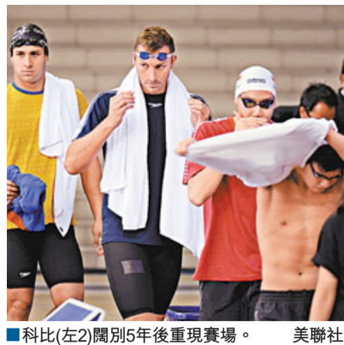
科比(左2)闊別5年後重現賽場。