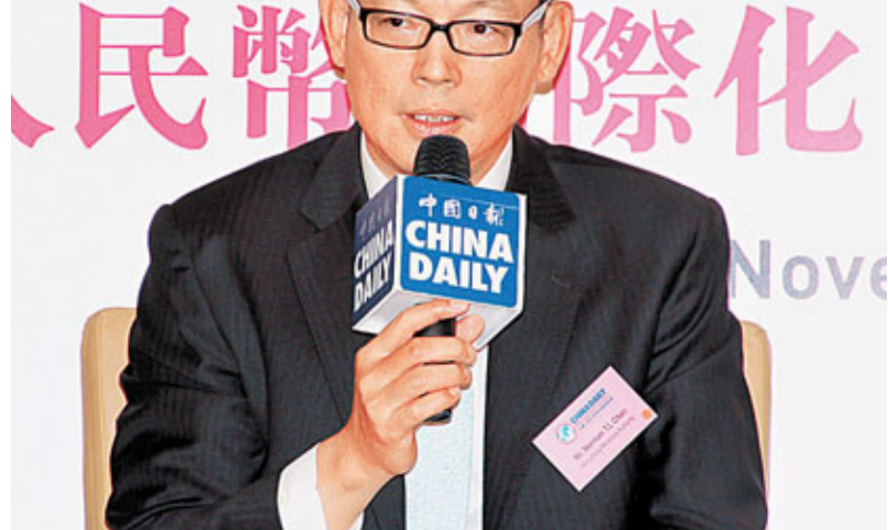
金管局總裁陳德霖表示，歐洲央行突然減息是合理做法，有助刺激經濟。

香港文匯報訊(記者 周紹基、涂若奔)歐債危機變幻莫測，令金融市場大幅波動。本港財金專家提醒，本港極易受到歐美各國經濟問題的衝擊，投資者及銀行需要做好歐債危機惡化的準備，保持足夠的資金流動性，以應對風險的來臨。