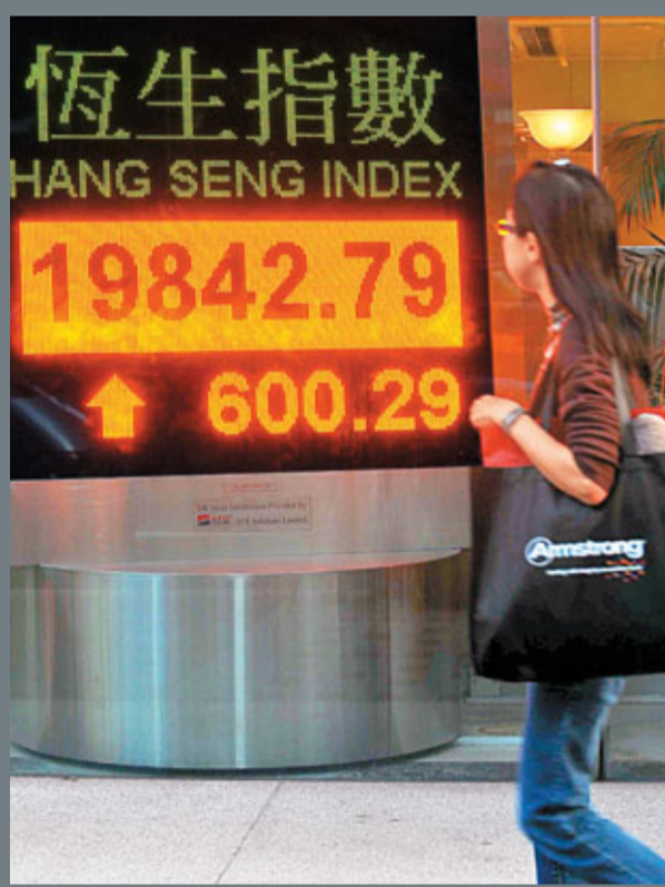
希臘可能放棄公投接納歐盟的拯救方案，利好周五港股氣氛，恒生指數收市大升3.12%。

20國集團(G20)峰會結束後，要求有巨額財赤的國家緊縮開支，有巨額盈餘的國家則要擴大內需，一眾內需股炒上，佳華(0602)急漲26%，春天百貨(0331)上升13.5%，連帶家電股、汽車股、乳業股也造好。不過，新地(0016)新盤「劈價」30%，消息打殘地產股，全周計，新地暴跌2.1%，長實(0001)暴跌3.9%，新世界(0017)因供股，股價更暴跌近5%。