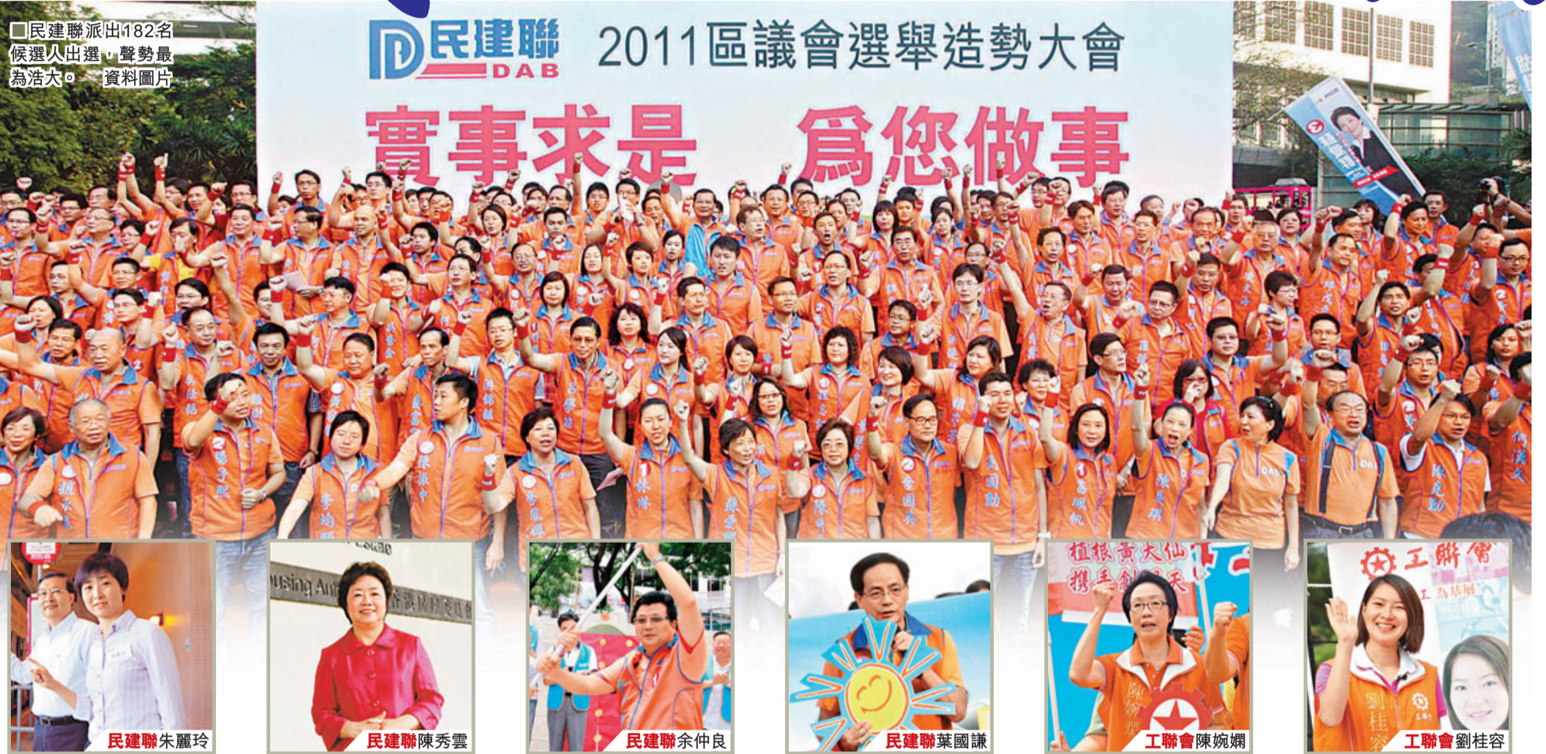
■民建聯派出182名候選人出選，聲勢最為浩大。

民建聯聲勢最為浩大，今屆派出多達182名候選人出選，當中不少面臨反對派左右夾擊，以至失實抹黑。民建聯主席譚耀宗坦言，民建聯在選舉衝刺期，會繼續過往的拉票策略，高舉「實事求是」的民生牌，強調雖然外界有評論指，民建聯今次選戰很輕鬆，但個人的評估則是「選情嚴峻」，對手亦早打悲情牌，加上民建聯高質力的候選人多已自動當選，剩餘的候選人選情相對艱巨，至於會否「告急」則會按需要而定。