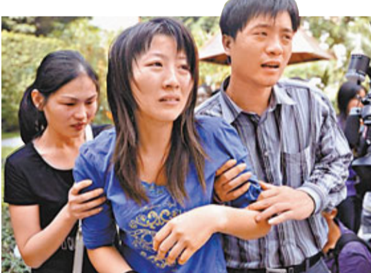
■小悅悅父母每當想起女兒都悲痛欲絕。資料圖片