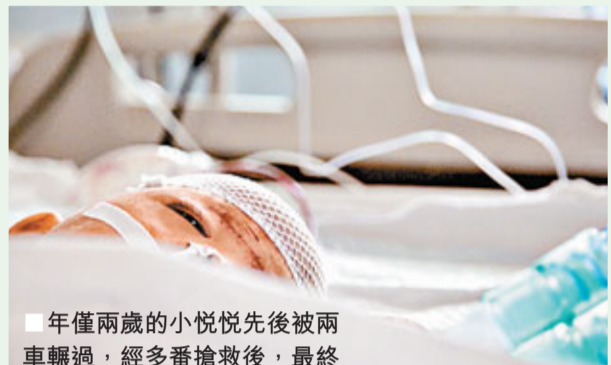
■年僅兩歲的小悅悅先後被兩車輾過，經多番搶救後，最終傷重不治。資料圖片

作者簡介 戴慶成：《環球時報》、《環球人物》、《鳳凰周刊》等內地媒體撰稿人。另定期為香港《成報》、《新報》撰寫時政評論文章。 電郵：taihingshing@gmail.com 陳振寧：「一國兩制」研究中心研究員。亞太國際關係學會成員。定期於香港《成報》發表評論文章。曾參與《通識詞典3》的撰寫工作。 電郵：jambon777@yahoo.com.hk