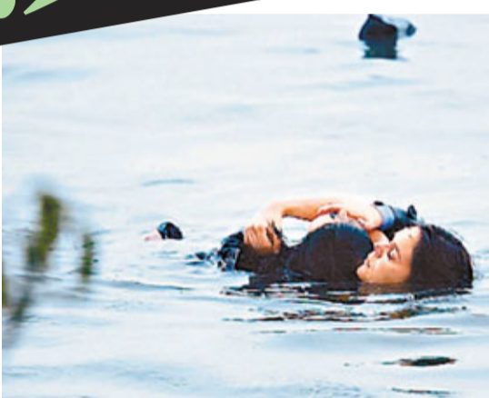
■早前浙江省杭州市有人不慎落入西湖，美國女遊客馬上下水將其救起，勇敢行為備受讚賞。