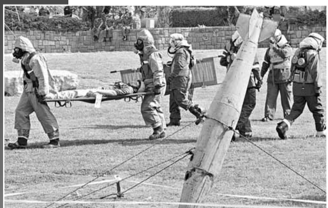
以色列前日試射飛彈(左圖)，並進行模擬遭遇導彈襲擊的演習。

國際原子能機構(IAEA)下周將發表報告，預料會提及伊朗不理會聯合國制裁，企圖私下建造及測試核武。英國媒體報道，鑑於中東形勢轉趨緊張，英美兩國正擬訂聯合攻擊伊朗的計劃，主要針對其核設施。英國甚至已為開戰作好準備。