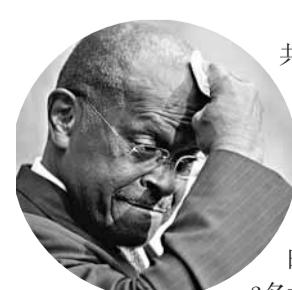
角逐美國共和黨總統候選人提名的凱恩(見圖)接連爆性醜聞，前日再出現第3名女子，聲稱曾遭凱恩性騷擾。凱恩指控另一參選人佩里採卑鄙手段向媒體報料，後者否認有關指控。

該女子前日向媒體表示，凱恩在1990年代任職美國餐館協會會長時，曾對她作出性挑逗行為，又向同事形容她誘人，邀請她到寓所，她其後刻意減少與凱恩接觸，加上有女同事經已投訴，故無採任何行動。