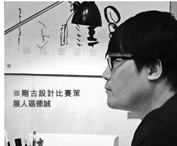
■剛古設計比賽策 展人區德誠