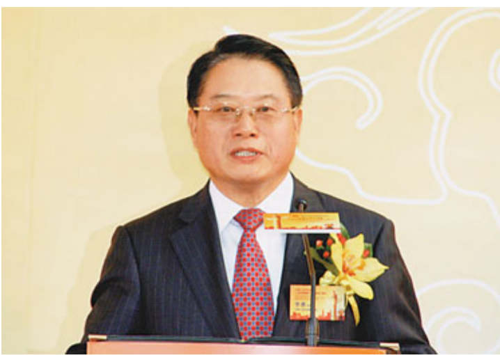
李勇表示，明年的經濟工作將繼續着力於保持經濟穩定快速增長、結構轉型以維持可持續發展，及通脹管理。

基於全球經濟復甦環境不確定性加大，李勇指出，國際貿易保護主義的抬頭、人民幣升值、原料成本上升等諸多因素，令中國出口企業面臨很大困難。