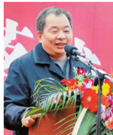
宋衛平強調公司不會倒下。