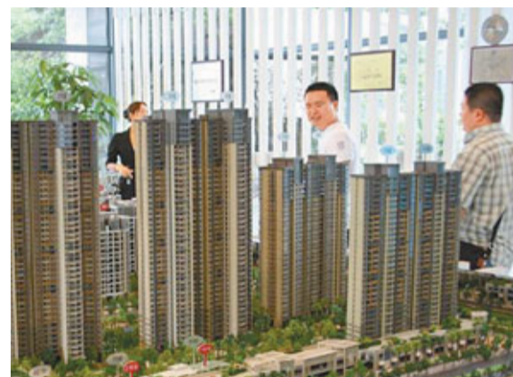
穗10月樓市呈現量價齊跌。

香港文匯報訊(記者 古寧 廣州報導)在嚴密調控之下，廣州樓市「金九銀十」今年不復存在。網易房產監控廣州國土房管部門旗下陽光家緣網數據顯示，今年9月穗一手住宅成交量與去年同月比大幅下降