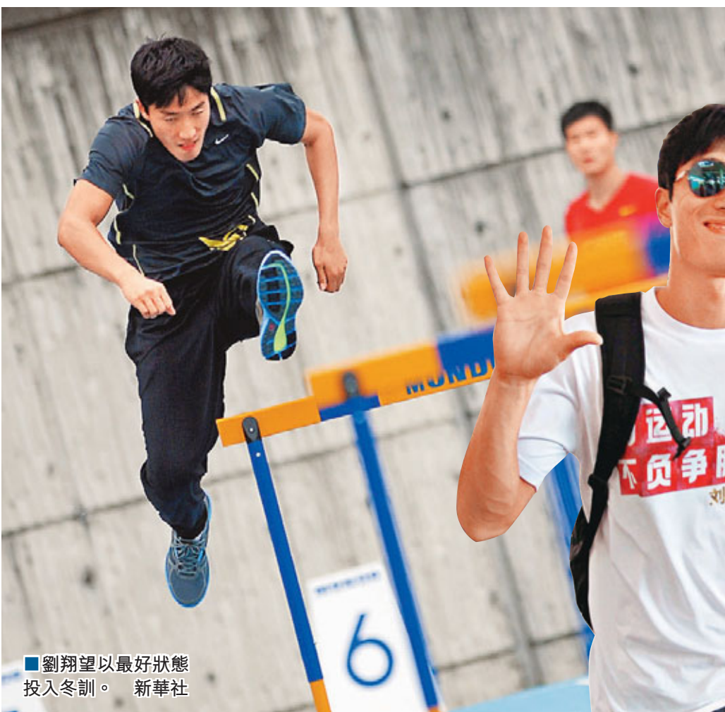
劉翔以最好狀態投入冬訓。