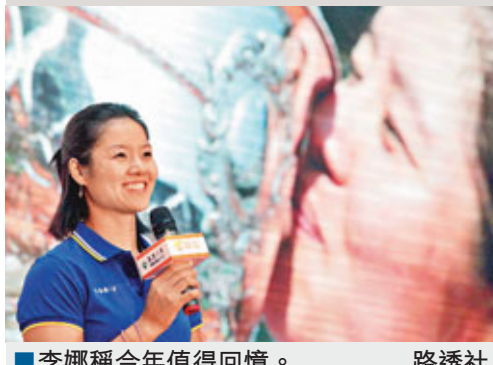
李娜稱今年值得回憶。 路透社