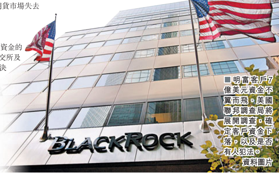
明富客戶7億美元資金不翼而飛，美國聯邦調查局將展開調查，確定客戶資金下落，以及是否有人犯法。資料圖片

持有逾12億美元（約93.2億港元）明富債權的摩根大通，正向法庭尋求保護明富的現金。有明富員工透露，該公司的客戶現時焦慮不安，部分客戶擬透過訴訟取回資金。