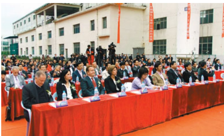
■貴陽市相關領導、合作夥伴、媒體記者以及GTAT公司總裁兼首席執行官Tom Gutierrez等共同見證了這顆亞洲最大的藍寶石晶體。