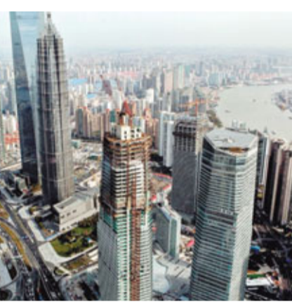
■上海陸家嘴金融城管理體制創新方案目前已經形成。圖為陸家嘴金融區。

等。其核心體制以充分體現「業界自治」為原則。所謂「業界自治」，是指關係到陸家嘴金融城發展，涉及到金融機構的事情要聽金融機構意見。業界自治的主體不是居民，而是企業，是以企業金融機構為主的載體。