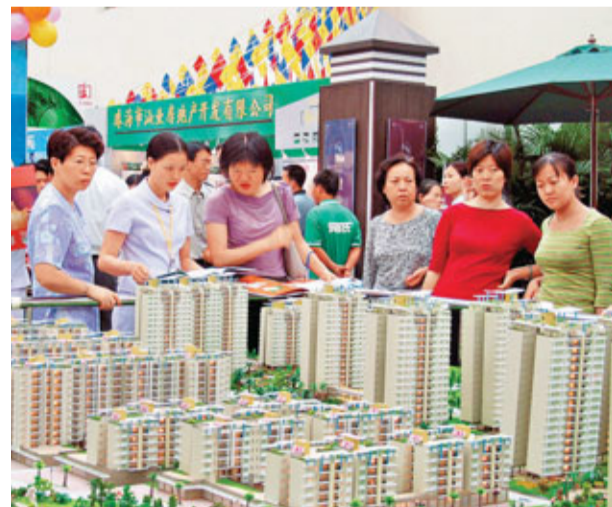
■目前珠海香洲區樓盤銷售價格都超過11,285元/平方米的指標線。圖為市民在參觀預售盤模型。

香港文匯報訊(記者 黃殿晶、張廣珍 珠海報道)為確保實現珠海市2011年度房價控制目標,1日起,珠海市率先對該市房地產市場實行限購限價的「雙限」政策。限購主要針對珠海主城区,橫琴新區不在限購之列。本地居民和繳納一年以上社保的外地人,只能在香洲購一套房。另外,對於全市新申請預售的樓盤,價格不得超過11,285元(人民幣,下同)/平方米,否則將不批預售。業內人士稱,「雙限」政策將掀樓市降價潮,重創珠海樓市。