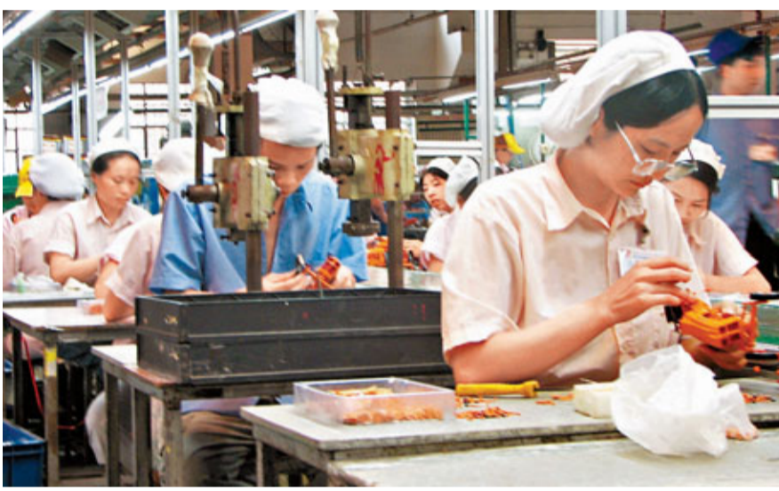
■增值稅和營業稅的起徵點大幅上調,對企業來說是重大利好。圖為一企業工人在裝配產品。

財政部財科所副所長白景明指出,提高增值稅起徵幅度將減輕企業稅收負擔,扶持小微企業發展。由於眾多小微企業分佈在生活服務領域,如交通運輸、理髮行業、旅遊業等,提高營業稅