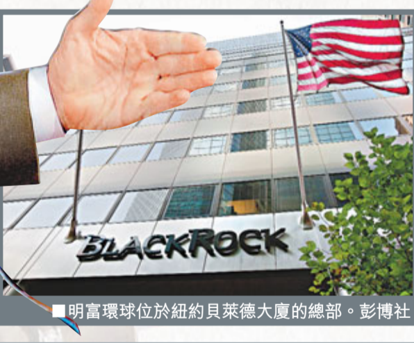
■明富環球位於紐約貝萊德大廈的總部。