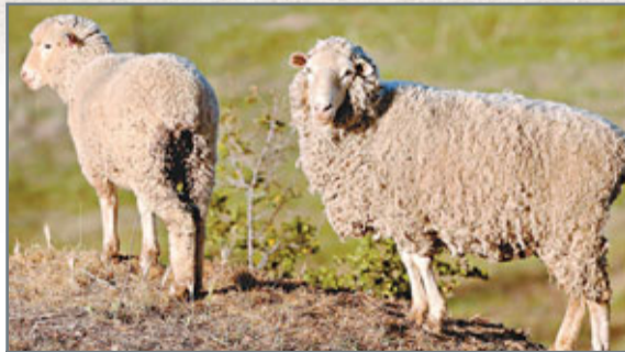
■澳洲羊毛期貨是全球纖維業最重要指標之一。

明富環球申請破產保護，芝加哥商品交易所、洲際交易所及倫敦金屬交易所都停止明富產品買賣。但澳洲證券交易所更進一步，宣布中止一切穀物和羊毛期貨交易，直至另行通知。