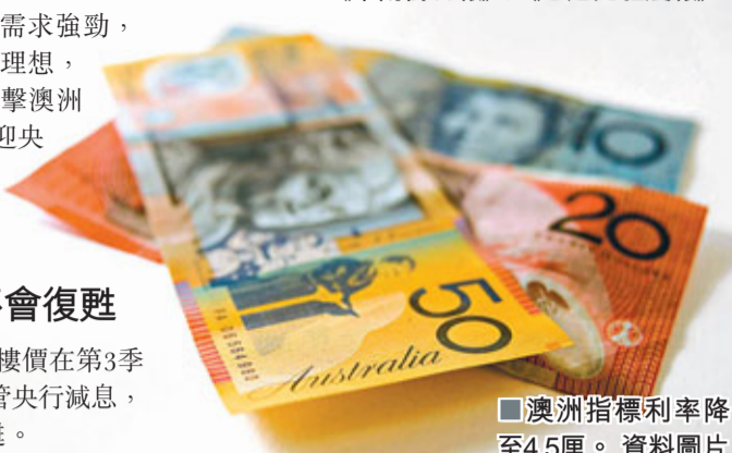
■澳洲指標利率降至4.5厘。資料圖片