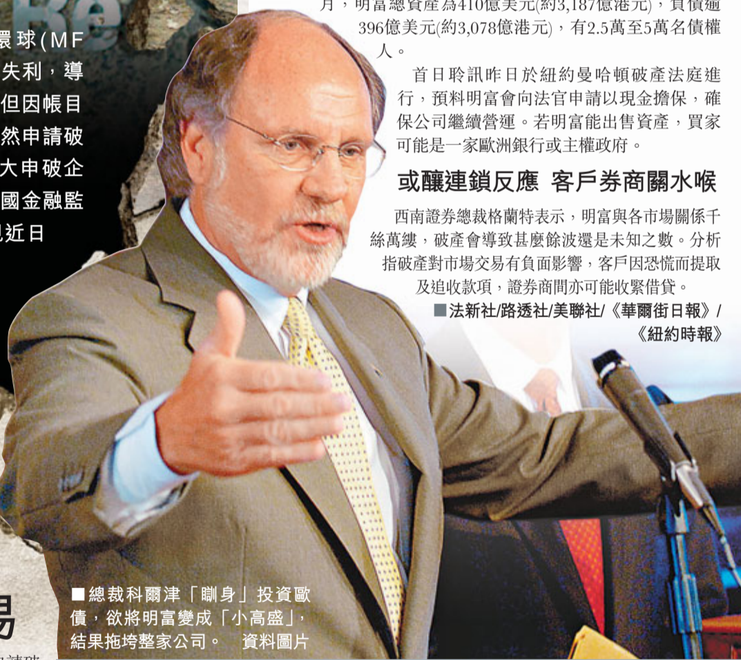
■總裁科爾津「瞞身」投資歐債，欲將明富變成「小高盛」，結果拖垮整家公司。

美國期貨交易商明富環球(MF Global)因押注歐洲主權債券失利，導致鉅額虧損，原試圖賣盤，但因帳目混亂以致交易告吹，前日突然申請破產保護，成為美國歷來第8大申破企業。《紐約時報》報道，美國金融監管機構極關注事件，並發現近日明富有多達9.5億美元(約73.8億港元)客戶資金不翼而飛，正調查是否被人挪用。